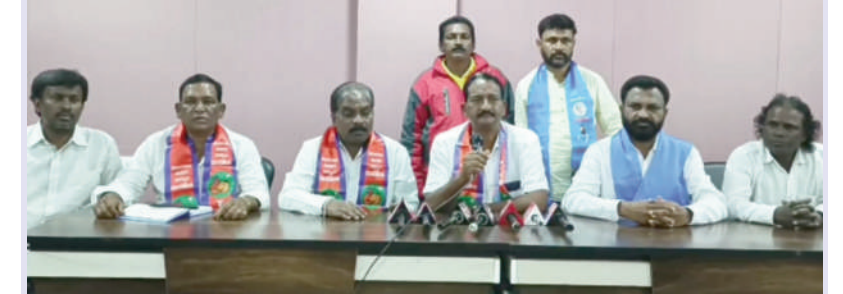
టైమ్స్ ఆఫ్ వార్త - మాక్లూర్.

యునైటెడ్ ఫ్రెండ్స్ రాష్ట్ర అధ్యక్షులు కొక్కెర్ భూమన్న