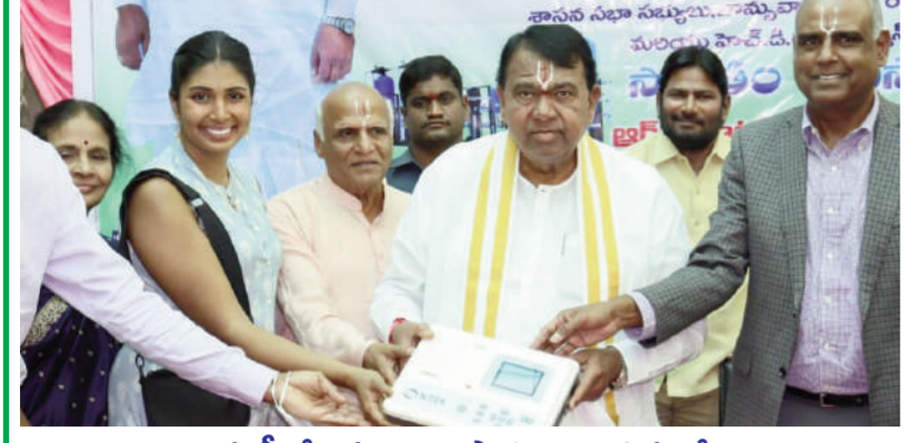
ఈ.సి.జీ. యంత్రాన్ని ప్రారంభించిన మాజీ స్పీకర్ పోచారం శ్రీనివాస్ రెడ్డి...