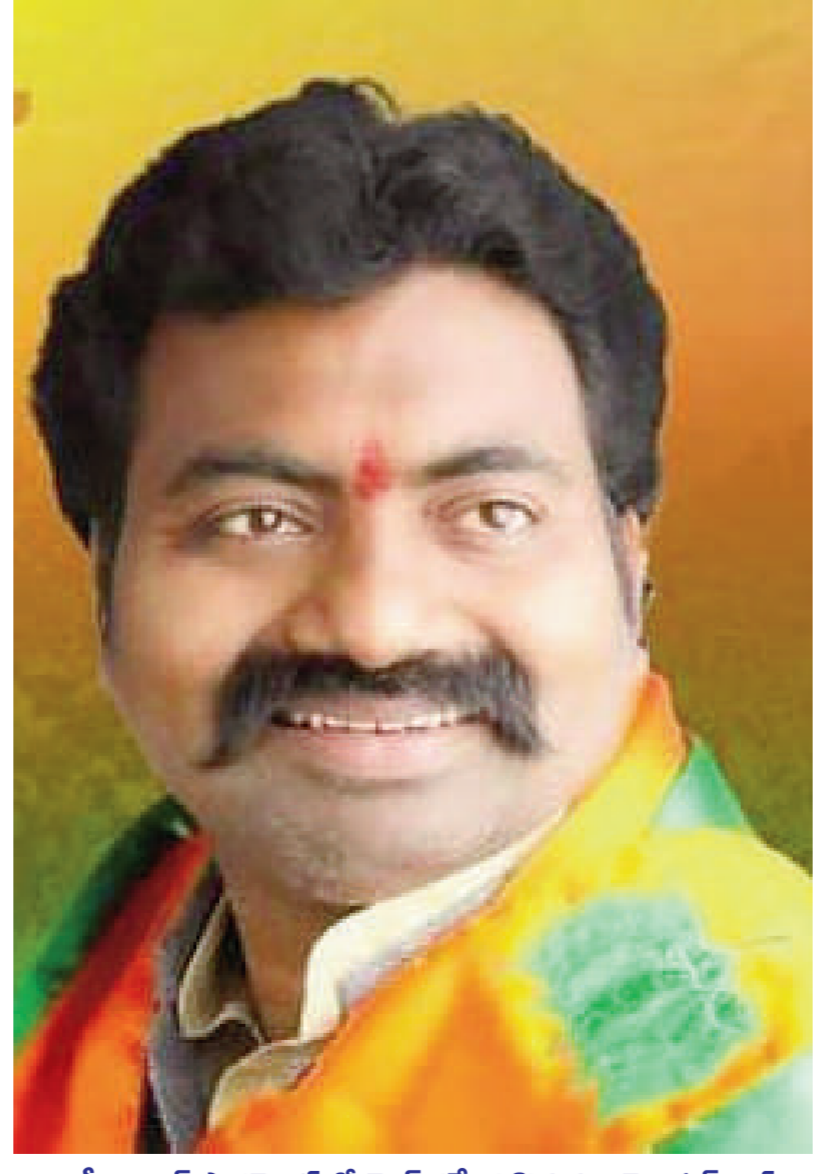
టైమ్స్ ఆఫ్ వార్త -బిమ్మండ.