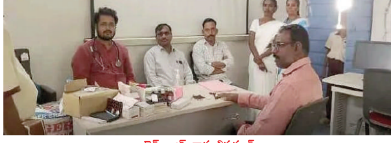
టైమ్స్ ఆఫ్ వార్త-బిక్కువూర్