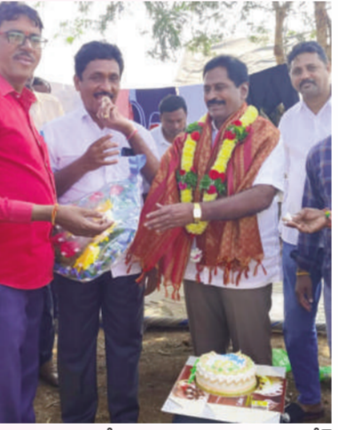
టైమ్స్ ఆఫ్ వార్త - నిజామాబాద్ స్టాన్డీ