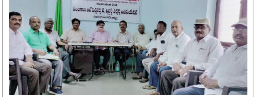
టైమ్స్ ఆఫ్ వార్త - నిజామాబాద్ సిటీ