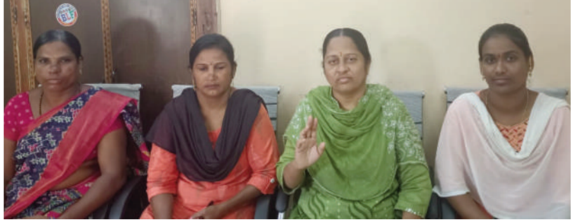
టైమ్స్ ఆఫ్ వార్త - నిజామాబాద్ సిటీ