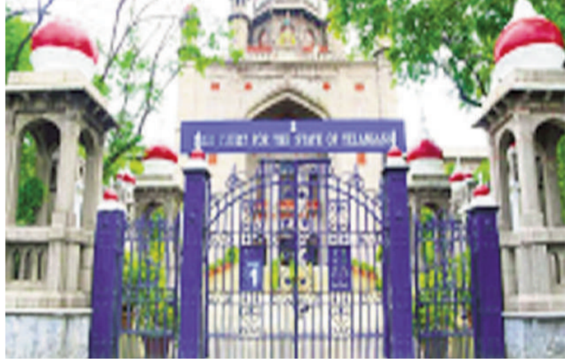
టైమ్స్ ఆఫ్ వార్త - హైదరాబాద్ :