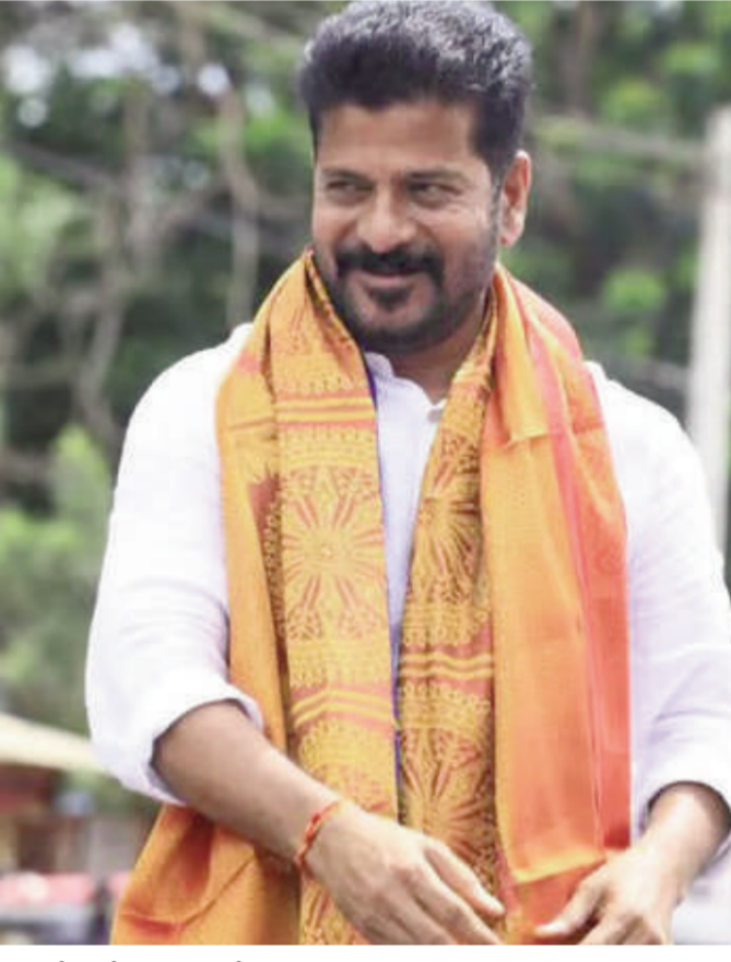
లేవని సిఎం రేవంత్ రెడ్డి చెప్పారు. సిపిలు ఎవరు కూడా పోస్టింగ్ లేదని సిఎం రేవంత్ పేర్కొన్నారు. అధికారుల నియామకంలో పైరవీలు కోసం తనను ఆడలేదు అని ఆయన తెలిపారు.