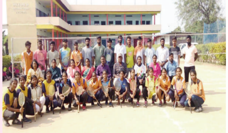
టైమ్స్ ఆఫ్ వార్త - నిజామాబాద్ స్టాన్డీ