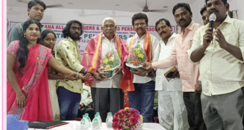
విసతి పత్రం అందజేత

కళాకారుల ఆధ్వర్యంలో ప్రాఫెసర్ కోదండరామ్ కు