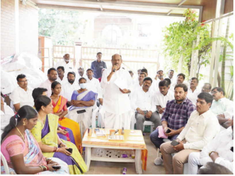
టైమ్స్ ఆఫ్ వార్త - నిజామాబాద్ రూరల్