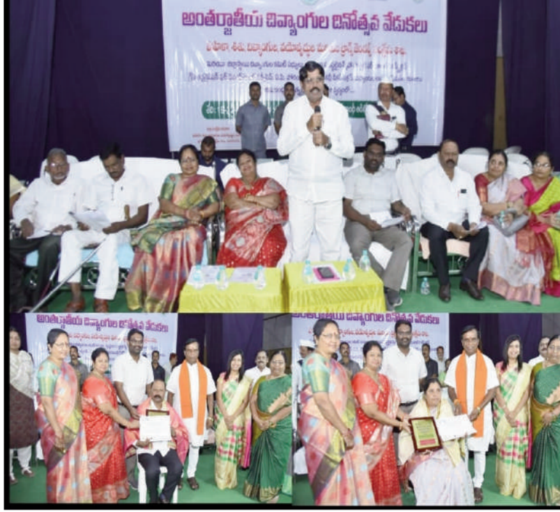
టైమ్స్ ఆఫ్ వార్త - నిజామాబాద్ సీట్