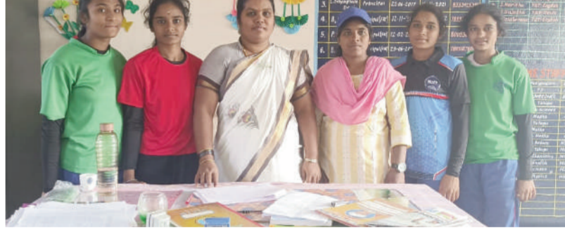
టైమ్స్ ఆఫ్ వార్త - నిజామాబాద్ స్టేట్స్