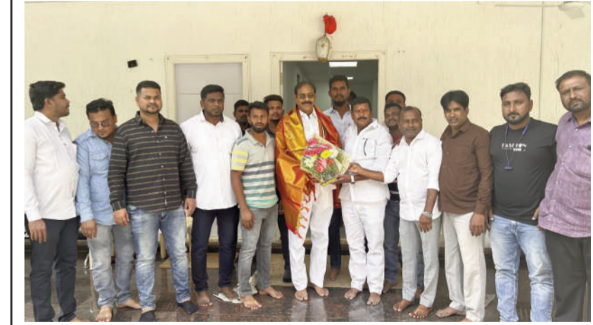
టైమ్స్ ఆఫ్ వార్త - కూకట్ పల్లి