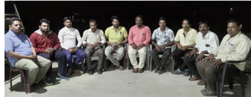
టైమ్స్ ఆఫ్ వార్త - బోనకల్