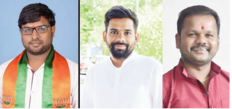
టైమ్స్ ఆఫ్ వార్త నిజామాబాద్ సీట్