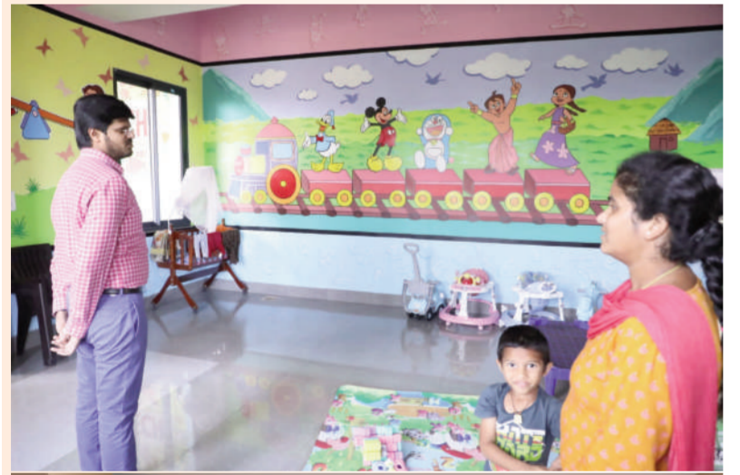
టైమ్స్ ఆఫ్ వార్త - ఖమ్మం