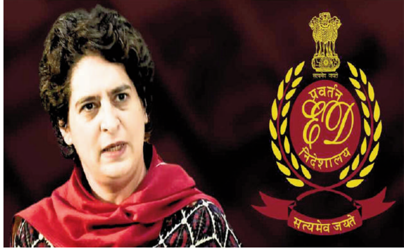
మనీలాండరింగ్ కేసులో తొలిసారి సోనియా కుమార్తె పేరు