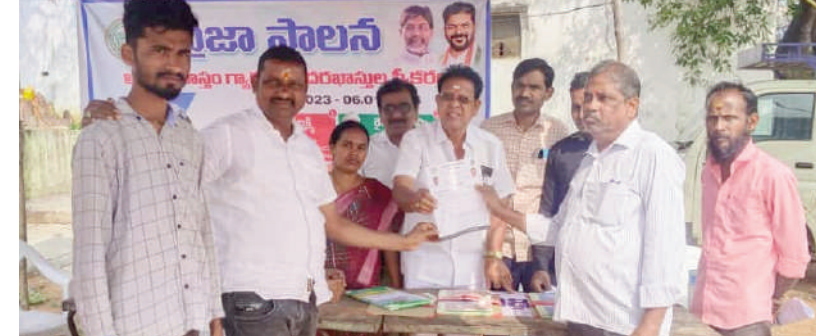
టైమ్స్ ఆఫ్ వార్త - బాన్సువాడ:

బాన్సువాడ మున్సిపాలిటీ కేంద్రంలో పాటు డివిజన్లో పరిధిలోని అన్ని మండల కేంద్రాలలో, గ్రామాలలో, గురువారం నుండి ప్రజాపాలన దరఖాస్తుల స్వీకరణ ఘనం అయినట్లు సంబంధిత అధికారులు పేర్కొన్నారు. ఐదు పథకాల కోసం ఒకే దరఖాస్తుల ప్రభుత్వం ఖరారు చేసింది. మహాలక్ష్మి, రైతు భరోసా, గృహశోధి, ఇందిరమ్మ ఇల్లు, చేయూత పథకాల కోసం అందులోని వివరాలు సమర్పించాల్సి ఉంటుంది. ఇంటి యజమాని పేరు, పుట్టిన తేదీ, సామాజిక వర్గం, ఆధార్, రేషన్ కార్డ్, మొబైల్ నెంబర్, వృత్తి, చిరునామా, కుటుంబ సభ్యులందరి వివరాలు వంటి 10 అంశాలను పూజించాలి. ఆ తర్వాత అభ్యుదాన హస్తం గ్యారంటీ పథకాల్లో దీనికి దరఖాస్తు చేస్తూనే వాటికి డిక్లెయర్ చేయాలని దరఖాస్తులో పేర్కొన్నారు. గురువారం నుండి డిసెంబర్ 6 వరకు దరఖాస్తుల స్వీకరిస్తున్నట్లు అధికారులు పేర్కొన్నారు. మండలాలు, గ్రామాలు, వార్డుల వారిగా ప్రత్యేక అధికారులు నియమించినట్లు వారు పేర్కొన్నారు. దరఖాస్తులు పూర్తిచేసి అధికారులకు అప్పగించి రసీదు స్వీకరించాలని వారు పేర్కొన్నారు.