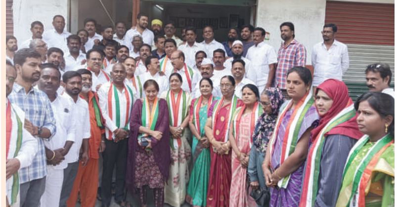
టైమ్స్ ఆఫ్ వార్త - నిజామాబాద్ సీట్