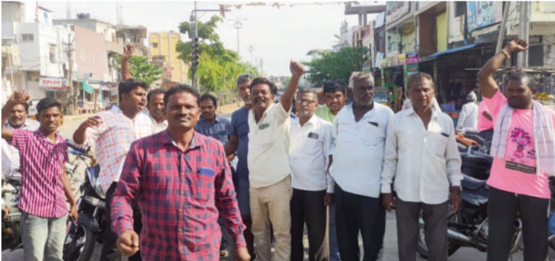
టైమ్స్ ఆఫ్ వార్త - బాన్సువాడ: