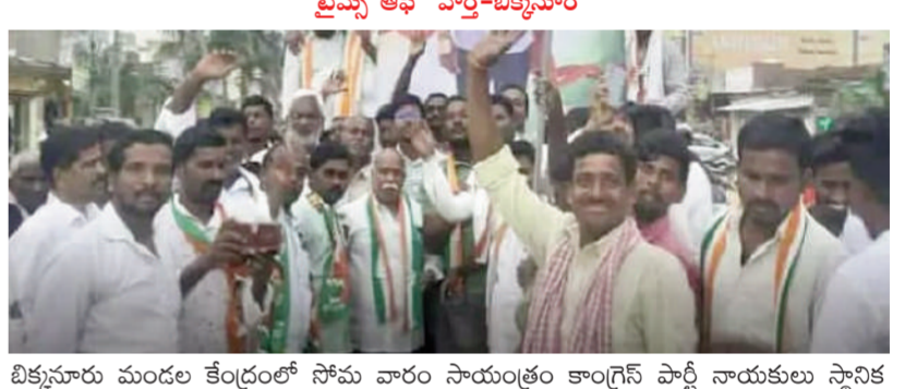
టైమ్స్ ఆఫ్ వార్త - భిక్కునూర్

భిక్కునూర్ మండల కేంద్రంలో సోమ వారం సాయంత్రం కాంగ్రెస్ పార్టీ నాయకులు స్థానిక సినిమా టాకీస్ చౌరస్తా వద్ద, భారీ రాష్ట్ర నిర్వహించి సంబరాలు నిర్వహించారు. ఈ సందర్భంగా కాంగ్రెస్ పార్టీ నాయకులు మాట్లాడుతూ, కాంగ్రెస్ పార్టీ అధికారం లోనికి రావడంతో పాటు ముఖ్యమంత్రిగా రేవంత్ రెడ్డి ఎన్నిక కావడం ఖాయమని అధికారం లోనికి రాగానే 6 గ్యా రంటీలను అమలు చేస్తామన్నారు. కార్యక్రమంలో పార్టీ నాయకులు ప్రజా పతినిధులు పాల్గొన్నారు.