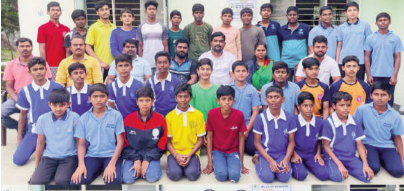
టైమ్స్ ఆఫ్ వార్త - నిజామాబాద్ సెక్షన్