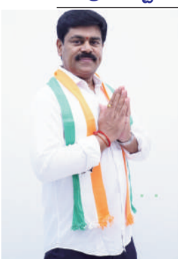
టైమ్స్ ఆఫ్ వార్త - మాక్సూర్