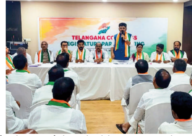
హోటల్లో జరుగుతున్న సీఎల్పీ సమావేశంలో రేవంత్, భట్టి విక్రమార్కు మధ్య గ్రూప్ వార్ సమస్యను చర్చించారు. దీంతో కాంగ్రెస్ ప్రభుత్వ ఏర్పాటు మరింత జాప్యం కానుంది. సీఎం ఎవరో అధిష్టానం తేల్చేయాల్సి ఉండటంతో