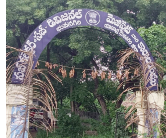
బ్రిష్టు ఆఫ్ వార్త - యాదాద్రి ప్రత్యేక ప్రతినధి

నాడు రెవెన్యూ శాఖలో పేరుకుపోయిన అవినీతి అక్రమాలను రూపు మాపేందుకు నాటి ముఖ్యమంత్రి ఎన్టీ రామారావు భూ రెవెన్యూ చట్టంలో తీసుకొచ్చిన పటిల్ పట్టాన్ని వ్యవస్థను రద్దుచేసి సంవలసం సృష్టించారు. అదే విధంగా కెసిఆర్ ప్రభుత్వం రాష్ట్రంలోని రెవెన్యూ శాఖలో నెలకొని ఉన్న అవినీతిని రూపుమాపేందుకు, పారదర్శకతను అందించేందుకు, రెవెన్యూ వ్యవస్థను ప్రక్షాళన చేసేందుకు నాటి ముఖ్యమంత్రి కేసీఆర్ ఆర్డీఆర్ చట్టంలో మార్పులు తీసుకొచ్చి పీఆర్ఎస్ వ్యవస్థను రద్దు చేస్తూ సంవలసిన నిర్ణయాన్ని తీసుకొన్నారు. అప్పట్లో తెలంగాణ రాష్ట్రంలో ఉన్న ఆర్డీఆర్ కార్యాలయాల్లో విధులు లేక బోసిపోతున్న కార్యాలయాల సిబ్బందిని ఇతరతర శాఖల్లో భర్తీ చేసేందుకు తీసుకున్న నిర్ణయం అన్వేషాన్ గా వాయిదా వేసిన విషయం పొందటం పరిపాటిగా మారడంతో ప్రభుత్వ ఖజానాకు భారీగా