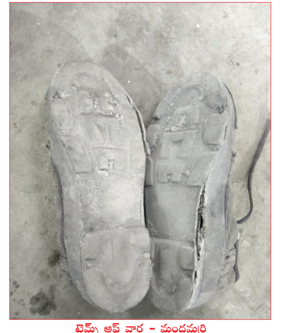
టైమ్స్ ఆఫ్ వార్త - మందమర్రి

పేరుకే పరిమితమైన రక్షణ చర్యలు సమయానికి అందని బూట్లు