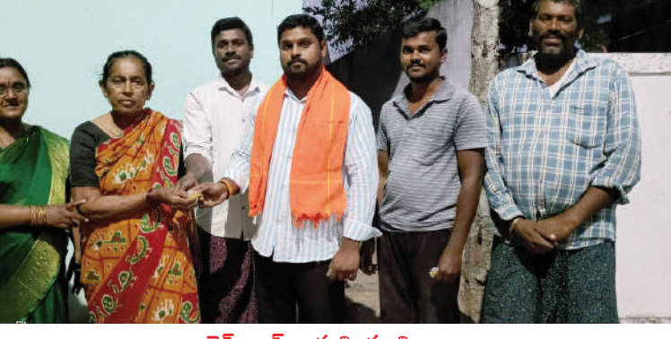
టైమ్స్ ఆఫ్ వార్త చింతకాని

నాగులవంచ గ్రామంలో అయోధ్య రామ మందిరం నుంచి వచ్చినటువంటి అక్షంతలు వితరణ ప్రతి గడపగడపకు అందజేయటం జరిగింది