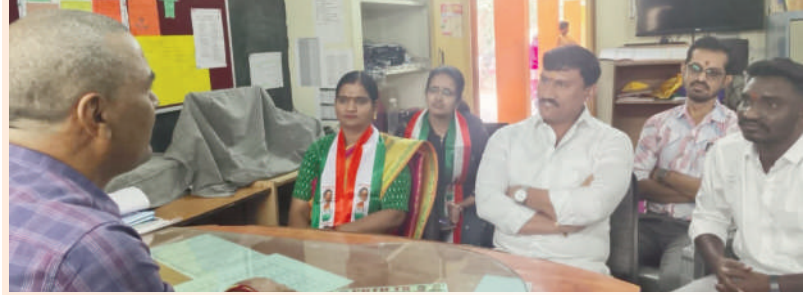
టైమ్స్ ఆఫ్ వార్త - కూకట్ పల్లి

హాస్టల్ కి ఎమ్మెల్యే అని చెప్పుకునే ఎమ్మెల్యే...? వివి నగర్ ప్రభుత్వ పాఠశాల సమస్యలు కనపడలేదా...? విద్యకల్పన ఏకాంత్ గౌడ్..