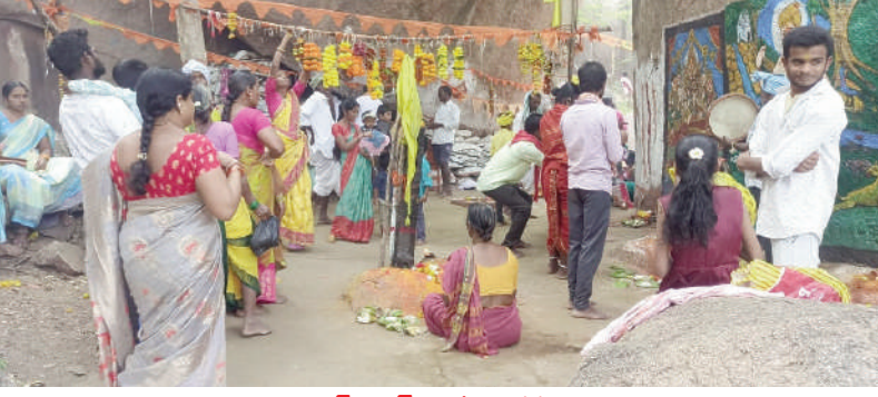
టైమ్స్ ఆఫ్ వార్త - ఎడపల్లి

గొల్ల కురుమల ఆరాధ్య దైవమైన శ్రీ మల్లికార్జున స్వామి కి సట్టి పండగ సందర్భంగా గొల్లకురమ భక్తులు నైవేద్యాలను సమర్పించి మొక్కులు తీర్చుకున్నారు. ఎడపల్లి మండలంలోని రాజాకలూర్ గ్రామ శివారులోని కొండల్లో వెలసిన శ్రీ మల్లికార్జున స్వామిని దర్శించుకునేందుకు భక్తులు అధిక సంఖ్యలో విచ్చేసారు. ప్రతి ఏడాది మార్గశిర మాసంలో పౌర్ణమి తరువాత వచ్చే ఆదివారాల్లో గొల్ల కురుమ కులస్తులు సట్టి పండగ కార్యక్రమం నిర్వహించడం ఆనవాయితీ. పౌర్ణమి తరువాత వచ్చే బదు వారాల్లో భక్తులు బెల్లంతో తయారుచేసిన నైవేద్యాలను బోనాలూగా శ్రీ మల్లికార్జున స్వామికి సమర్పిస్తారు. ఈమేరకు ఆదివారం డోలు, బాజాల తో కొండపై గల