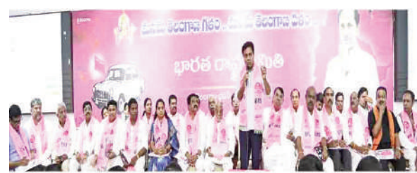
బైప్స్ ఆఫ్ వార్త - హైదరాబాద్ :