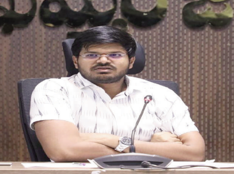
టైమ్స్ ఆఫ్ వార్త - ఖమ్మం

ప్రజాపాలన కార్యక్రమంలో స్వీకరించిన దరఖాస్తులను, ప్రజాపాలన పోర్టల్ లో నమోదు ప్రక్రియను ప్రత్యేక అధికారులు పర్యవేక్షణ చేయాలని, నిర్ణీత సమయంలోగా పూర్తి అయ్యేలా కార్యాచరణ చేయాలని జిల్లా కలెక్టర్ వి.పి. గౌతమ్ తెలిపారు. సోమవారం నూతన కలెక్టరేట్ లోని సమావేశ మందిరంలో ప్రజాపాలన కార్యక్రమ ప్రత్యేక అధికారులతో డాటా నమోదుపై జిల్లా కలెక్టర్ సమీక్ష నిర్వహించారు. ఈ సందర్భంగా ఆయన మాట్లాడుతూ డిసెంబర్ 28 నుండి జనవరి 6 వరకు ప్రజాపాలన కార్యక్రమం క్రింద జిల్లా వ్యాప్తంగా గ్రామీణ, పట్టణ ప్రాంతాల్లో దరఖాస్తుల స్వీకరించడం జరిగిందని, ఇందులో భాగంగా గ్రామీణ ప్రాంతాల్లో 3,78,788 దరఖాస్తులు, పట్టణ ప్రాంతాల్లో 1,09,764 దరఖాస్తులు, మొత్తంగా 4,88,316 దరఖాస్తులు వచ్చాయన్నారు. జిల్లాలో 40 ప్రాంతాల్లో 1,310 మంది డాటా ఎంట్రి అప్డేట్లను నియమించి, డాటా ఎంట్రి ప్రక్రియ జనవరి 5 నుండి ప్రారంభించి, ఈ నెల 12లోగా పూర్తయ్యేలా కార్యాచరణ చేసినట్లు తెలిపారు. సోమవారం వరకు సుమారు 2 లక్షల డాటా ఎంట్రి పూర్తయినట్లు ఆయన అన్నారు. డాటా ఎంట్రి ఆపరేటర్లు, వారికి సూచించిన ప్రదేశాల్లో మాత్రమే ప్రక్రియ చేపట్టాలని తీసుకోవాలన్నారు. పంచాయతీ కార్యదర్శులు డాటా ఎంట్రి ప్రదేశంలో ఉండి, ప్రక్రియ కు సహకరించేలా చర్యలు చేపట్టాలన్నారు. ప్రత్యేక అధికారులు డాటా ఎంట్రిని సూపర్ చెక్ చేసి, ప్రక్రియ ను తనిఖీ చేయాలన్నారు. డాటా ఎంట్రి ఎలాంటి తప్పులు లేకుండా, వంద శాతం ఎర్రర్ ఫ్రీ గా ఉండేట్లు దృష్టి పెట్టాలన్నారు. ఈ సమావేశంలో ఖమ్మం మునిసిపల్ కమిషనర్ ఆదర్శ్ సురభి, జెడ్పీ సీజ్ అప్పారావు, ఆర్డీవోలు జి. గణేష్, అశోక్ చక్రవర్తి, ప్రత్యేక అధికారులు, తదితరులు పాల్గొన్నారు.