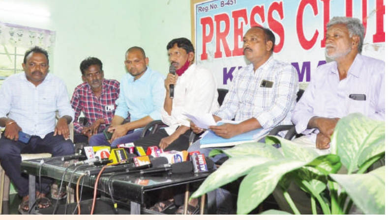
టైమ్స్ ఆఫ్ వార్త - ఖమ్మం

పగడాల నాగరాజు అతని బనామీ దారులపై కేసులు నమోదు చేయాలి ఇంటిపై సర్దుబాట్లకు కలిగిన మాకు ప్రభుత్వం న్యాయం చేయాలి విలేజరుల సమావేశంలో బాధితులు