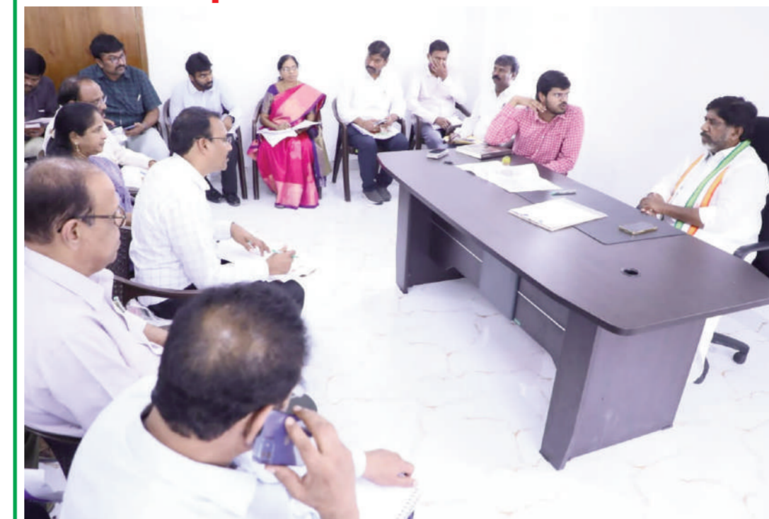
మధిర నియోజకవర్గ అభివృద్ధి పనుల పురోగతి సమీక్షలో రాష్ట్ర ఉప ముఖ్యమంత్రి, ఆర్థిక, ఇంధన శాఖల మంత్రి ముల్ల భట్టి విక్రమార్క