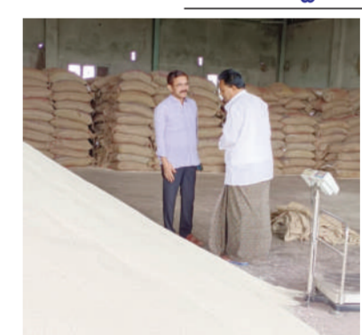
టైమ్స్ ఆఫ్ వార్త - ఖమ్మం