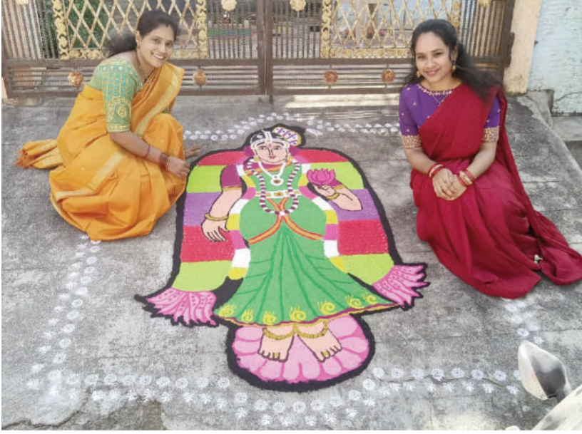
టైమ్స్ ఆఫ్ వార్త - కామారెడ్డి ప్రతినిధి

తెలుగు రాష్ట్రాల్లో సంక్రాంతి పండుగ సంబరాలు అంబరాన్ని అంటాయి. పండుగ శోభతో తెలుగు లోగట్ల కళకళలాడుతున్నాయి. సోమవారం సంక్రాంతి పండుగ వర్షదినం కావడంతో ఊరవాడ తెల్లవారు జామునే తెలుగింటి ఆడపడుచులు వాకిళ్లలో రంగు రంగుల ముగ్గులు వేస్తూ నంది చేసారు. సంక్రాంతి పండుగను తదితర ప్రాంతాల్లో గంగిరెద్దుల ఆటలు, హరిదాసుల నంకీరనలు, కళాకారుల ప్రదర్శనలు ఆకట్టుకున్నాయి. ఉదయం నుండి చిన్నారలు నంది చేయగా హిందూ సంస్కృతి సంప్రదాయాలను నేటితరం పిల్లలకు తెలిసి విధంగా ముగ్గుల రూపంలో వాకిళ్లలో అందంగా అలంకరించారు. కామారెడ్డి జిల్లా కేంద్రంలో గంగిరెద్దుల హడావిడితో పాటు కళాకారుల ఆటపాటలతో అచ్చం వల్లభారి వాతావరణాన్ని ప్రతిబింబించడంతో పాటు చిన్ననాటి మధుర స్మృతులు గుర్తుకొస్తుంటున్నాయి. కామారెడ్డి జిల్లా వ్యాప్తంగా ఆహారద్రవ వాతావరణంలో సంక్రాంతి వేడుకలు జరుపుకున్నారు. వేకువ జామునే ఇళ్ల ముందు కల్లాపి జల్లి, రంగుల రంగవల్లులు వేసి గొట్టెలు పెట్టారు. జిల్లా వ్యాప్తంగా సంక్రాంతి శోభ ఉట్టి పడింది. మూడు రోజుల పండుగలో భాగంగా తొలి రోజు భోగభాగాలు తెచ్చే బోగి పండుగను ప్రజలు అటవీసంగా జరిపారు. 37 వ వార్షికోత్సవ విద్యార్థినిగా కాలని లో వాకిళ్ల ముందు తీర్చిదిద్దిన రంగవల్లులు, గోదాదేవి ముగ్గు తో పాటు గొట్టెలు చూపరులను ఎంతగానో ఆకట్టుకోగా మంగళవారము పనుపుటోట్ల సందర్భంగా ఆడపడుచులు బొట్టు పెట్టుకుంటున్న ముగ్గు చిత్తం ఎంతో కూడా ముప్పటగా కనువిందు చేసింది.