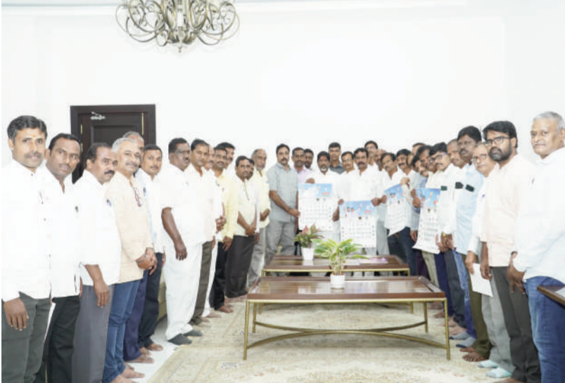
టైమ్స్ ఆఫ్ వార్త - మధిర