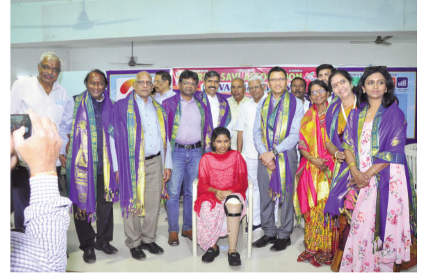
టైమ్స్ ఆఫ్ వార్త - ఖమ్మం