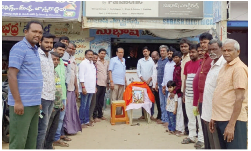
టైమ్స్ ఆఫ్ వార్త - సూర్యాపేట జిల్లా ప్రతినిధి