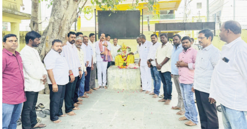
టైమ్స్ ఆఫ్ వార్త ఎన్టీపేట జిల్లా ప్రతినిధి..