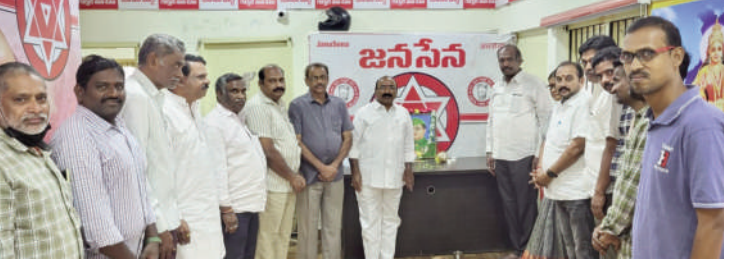
టైమ్స్ ఆఫ్ వార్త - కూకట్ పల్లి