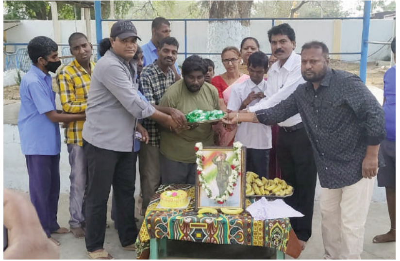
టైమ్స్ ఆఫ్ వార్త - మందపూరి: