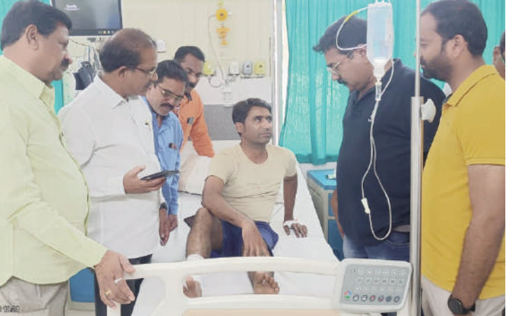
టైమ్స్ ఆఫ్ వార్త, మందపూరి:-