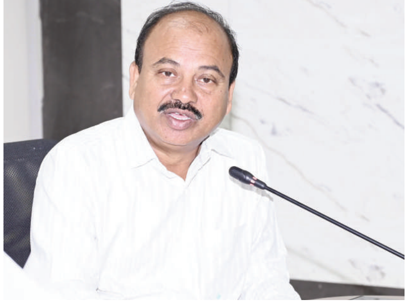
టైమ్స్ ఆఫ్ వార్త - చుహాబాబాద్ జిల్లా ప్రతినిధి