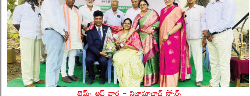
టైమ్స్ ఆఫ్ వార్త - నిజామాబాద్ సీట్