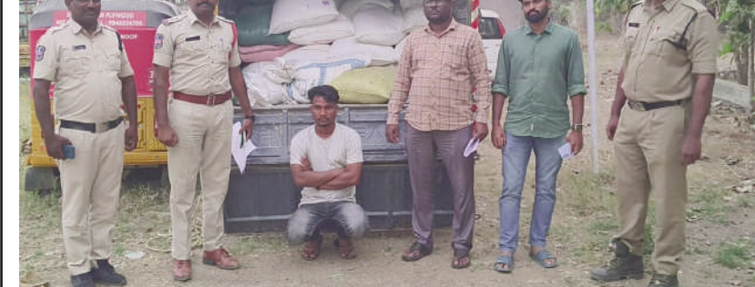
టైమ్స్ ఆఫ్ వార్త - ఎడపల్లి

అక్రమంగా రేషన్ బియ్యాన్ని తరలిస్తున్న వాహనాన్ని బుధవారం ఎడపల్లి పోలీసులు పట్టుకున్నారు. ఎడపల్లి మండలంలోని కుర్నూపల్లి గ్రామశివారులో టిఎన్ 08విసి4409 నంబర్ గల వాహనంలో బుధవారం సుమారు 25కిలోగ్రామ్ల రేషన్ బియ్యాన్ని పోలీసులు పట్టుకున్నారు. నిజామాబాద్ నుండి కుర్నూపల్లి మీదుగా అక్రమంగా రేషన్ బియ్యాన్ని తరలిస్తున్నారన్న విషయం ఎడపల్లి పోలీస్ లకు సమాచారం గుర్తు తెలియని పుక్తలు అందించ దంతో ఎడపల్లి ఎమ్మెల్యే తమ సిబ్బందితో కలిసి అక్రమ రేషన్ బియ్యంను తరలిస్తున్న వాహనాన్ని పట్టుకున్నారు. బియ్యంతో పాటు వాహనాన్ని స్వాధీనం చేసుకొని, వాహన డ్రైవర్ ను ఎడపల్లి పోలీస్ స్టేషన్ కు తరలించి డ్రైవర్ పై కేసు నమోదు చేసి రియోజు చేస్తున్నారు.