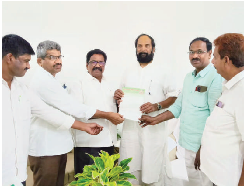
నాగార్జున సాగర్ ఎడమ కాలువకు నీటిని విడుదల చేసి పంటలను కాపాడాలని భారీ నీటిపారుదల శాఖామంత్రి ఉత్తమ్ కుమార్ రెడ్డి ని కలిసి వినిపి పత్రం అందజేశారు.

పాలేరు పాతకాలువ ఆయకట్టు ను, సాగర్ ఆయకట్టు క్రింద వేసిన పంటలను కాపాడాలి. - భారీ నీటిపారుదల శాఖామంత్రి ఉత్తమ్ కుమార్ రెడ్డిని కలిసిన సిపిఎం బృందం