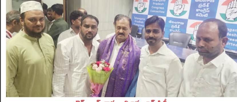
టైమ్స్ ఆఫ్ వార్త - నిజామాబాద్ సీట్