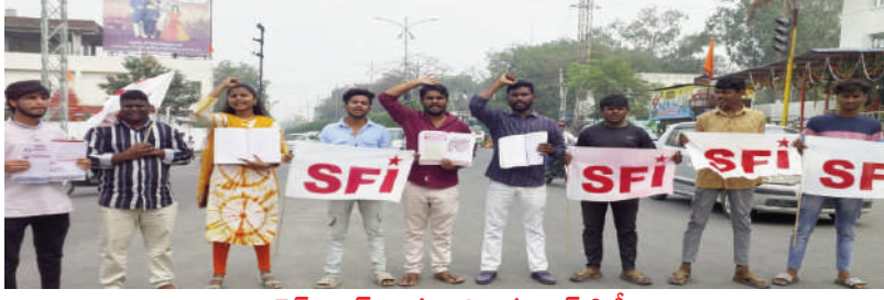
టైమ్స్ ఆఫ్ వార్త - నిజామాబాద్ సీట్

ఆర్థిక మంత్రి ఈ బడ్జెట్ లో విద్యారంగం అభివృద్ధికి చొరవ చూపాలి