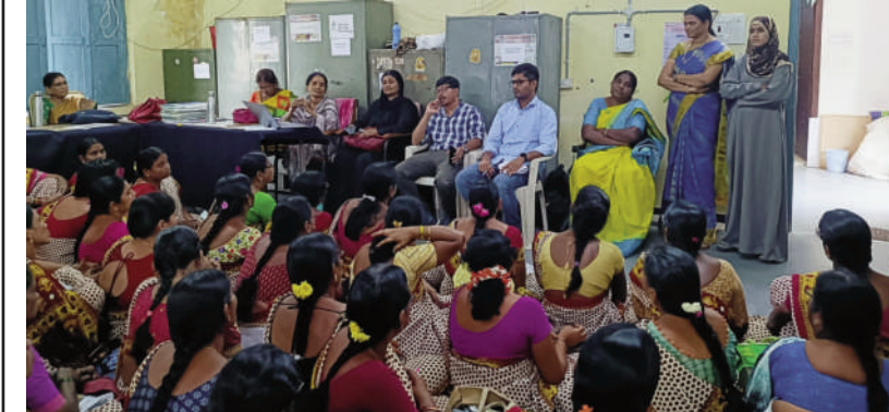
టైమ్స్ ఆఫ్ వార్త - బాన్సువాడ: