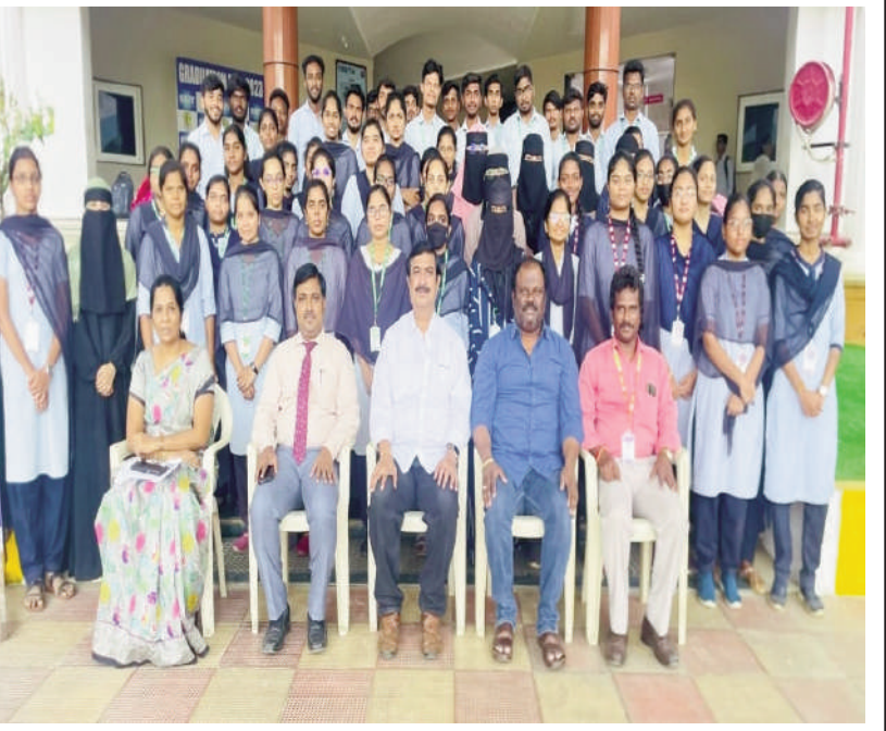
యస్.బి.ఐ.టి. లో పైతాన్ ప్రోగ్రామింగ్ పై ముగిసిన 5 రోజుల శిక్షణ