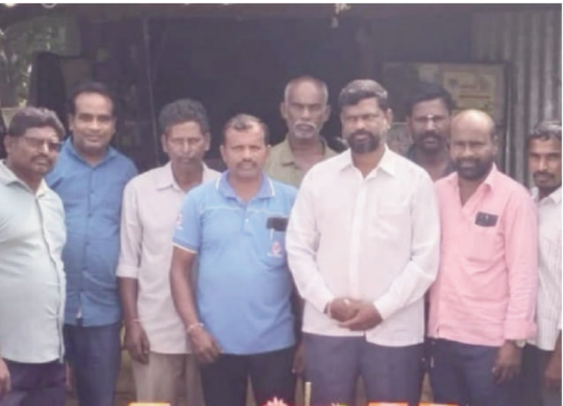
టైమ్స్ ఆఫ్ వార్త - జిల్లా ప్రతినిధి

విద్యుత్ శక్తి కనిపించకపోవచ్చు గాని ఎలక్ట్రిఫైడ్లు దానికి జీవం పోస్తారు ఎలక్ట్రిఫైడ్ విద్యుత్ శక్తి యొక్క అనుభవం కంట్రోల్ చేసే ఒక డైజిటల్ లాంటివారు ఎలక్ట్రిఫైడ్ లాన్సలం