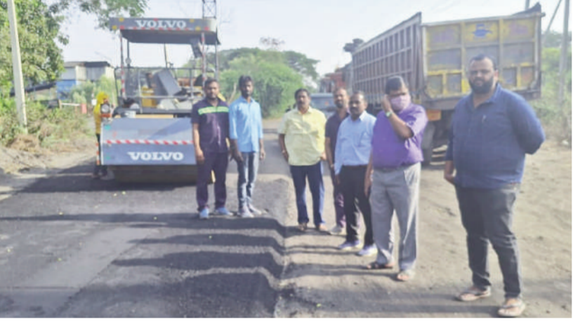
టైమ్స్ ఆఫ్ వార్త, మండపల్లి:-