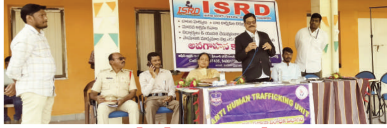
టైమ్స్ ఆఫ్ వార్త - సదాశివనగర్