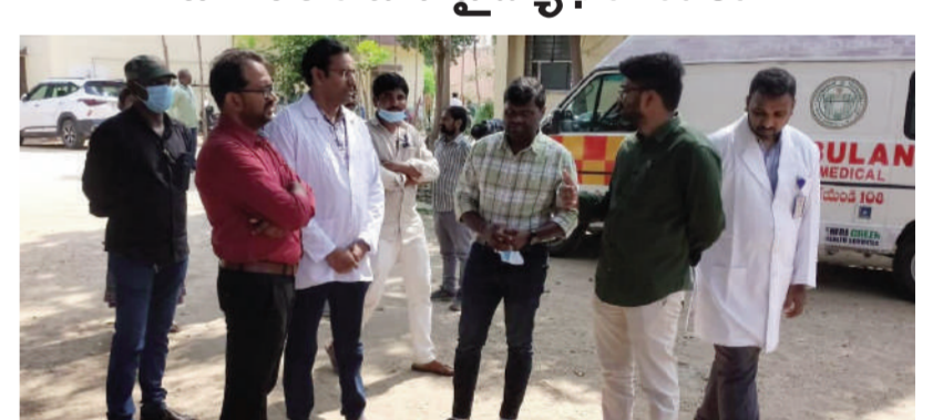
టైమ్స్ ఆఫ్ వార్త - బోధన్