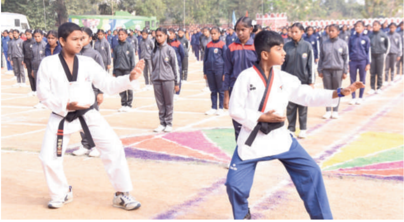
టైమ్స్ ఆఫ్ వార్త - నిజామాబాద్ కలెక్టరేట్

డి.ఎల్.ఎస్.పి అధ్యక్షులు స్వీయ ఆత్మరక్షణపై అవగాహన కార్యక్రమం