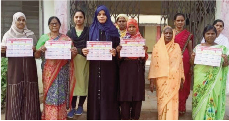
టైమ్స్ ఆఫ్ వార్త - ఎడపల్లి