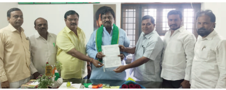
టైమ్స్ ఆఫ్ వార్త - కూకట్ పల్లి