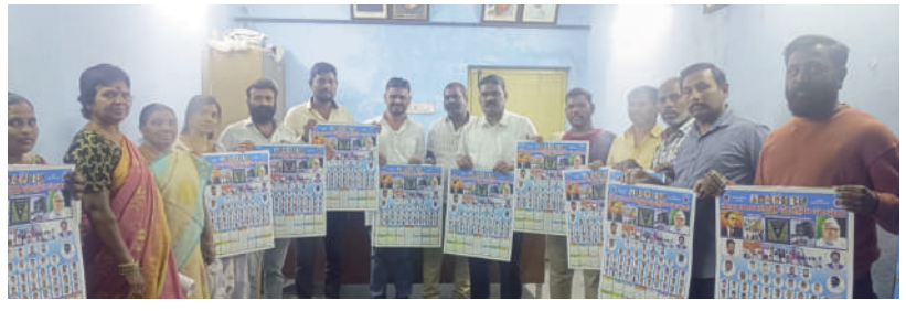
టైమ్స్ ఆఫ్ వార్త - కూకట్ పల్లి