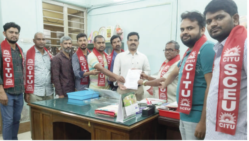
తైమ్స్ ఆఫ్ వార్త, మండపం:-