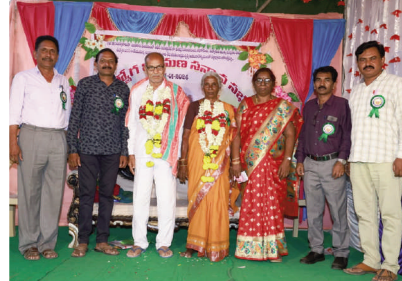
ఇండ్రవెల్లిలో మరో రెండు గ్రామస్థాయి కృతజ్ఞత సభలో మంత్రి పాంగులేటి