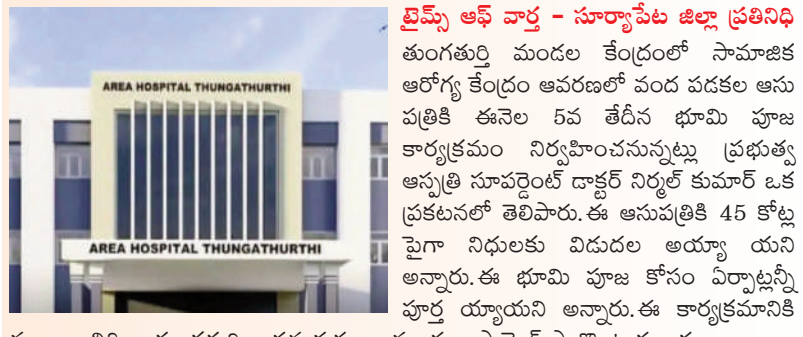
ముఖ్య అతిథిగా తుంగతుర్తి శాసన సభ్యులు మందుల సామెల్ పాల్గొంటారు.