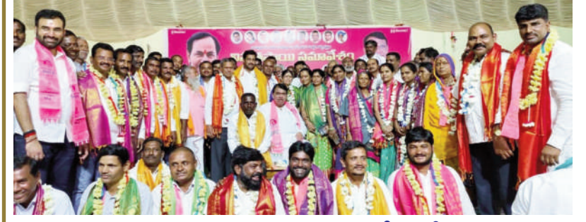
బాన్సువాడ నియోజకవర్గం బిసె నిర్వహణ చేసిన మాజీ స్పీకర్ పోచారం శ్రీనివాస్ రెడ్డి.....