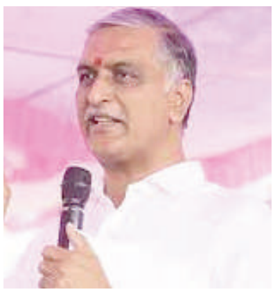
కానీ ఉన్న రెండు వేల పెన్షన్లను కూడా కట్ చేశారని విమర్శించారు. మిగతా 10లో..