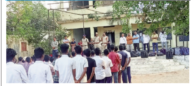
టైమ్స్ ఆఫ్ వార్త - ఎడపల్లి

ఇటీవల వాట్సాప్ గ్రూప్లో, సోషల్ మీడియాలో చైరల్ అవుతున్న కిడ్నాప్ ఊహలు, సైబర్ క్రైమ్ల గురించి ఎడపల్లి మండల కేంద్రంలోని జడ్పీ హైస్కూల్ తెలుగు మీడియం లో విద్యార్థులకు పోలీసులు అవగాహన కల్పించారు. ఈ సందర్భంగా రూరల్ సిఐ, ఎడపల్లి ఎస్పీ లు మాట్లాడుతూ... కిడ్నాప్ లపై విద్యార్థులు గాని ఇంకెవరైనా గాని పుకార్లను నమ్మకూడదని, అపరిచిత వ్యక్తులు లను నమ్మకూడదని అన్నారు. ఎవరికైనా గాని ఎవరిపైన గాని అనుమానం ఉంటే 100 ఫోన్ నెంబర్ కు దయలో చేయాలని, సైబర్ క్రైమ్ లకు సంబంధించి అపరిచిత వ్యక్తులతో చాటింగ్ చేయరాదని సూచించారు. తమ బ్యాంక్ అకౌంట్ నెంబర్ వివరాలు ఇవ్వరాదని తెలియజేశారు. ఈ కార్యక్రమంలో పోలీస్ సిబ్బంది, ప్రధానోపాధ్యాయులు సాయిలు, ఉపాధ్యాయులు, విద్యార్థులు పాల్గొన్నారు.