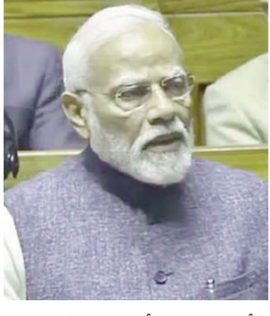
జరిగిన సంస్కరణలు, పనితీరు, పరివర్తనలతో కొత్త సమ్మతం పెరుగుతోంది.'ఈ ఐదేళ్ల దేశంలో లిఫామ్, పరీఫామ్, ట్రాన్స్ ఫామ్ సంబంధించినవి. మిగతా 5లో..

370ను తొలగించడం ద్వారా రాజ్యాంగం పూర్తిగా ఆవిష్కృతమైందని ప్రధాని మోడీ అన్నారు. తద్వారా జమ్మూ కశ్మీర్ ప్రజలకు అందించగలుగుతున్నామని అన్నారు. జీ-20కి అధ్యక్షత వహించే అవకాశం భారత్ కు దక్కిందని, వ్యవస్థలు మారినా దేశ ప్రజాస్వామ్య స్ఫూర్తి ఎప్పుడూ మారదని చెప్పారు. కరోనా సమయం లో కూడా దేశ కార్యక్రమాలు ఆగిపోనివ్వలేదని దేశ ఆర్థిక వ్యవస్థకు ప్రతి ఒక్కరూ తోడ్పాటు అందించారని కొనియాడారు. ఆ సమయంలో ఎంపీలు సైతం తమ నిధులను వదులుకున్నారు పేర్కొన్నారు. అందుకు ప్రతి ఒక్కరికీ కృతజ్ఞతలు తెలియజేస్తున్నానని ప్రధాని మోడీ అన్నారు. దేశానికి మరోసారి తీర్మానాలను జాతి పాదాల చెంత అంకితం చేసే అవకాశం వచ్చింది. ఈ ఐదేళ్ల దేశంలో