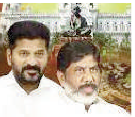
అమలు అవుతున్నాయన్నారు. తన భాషపై బీఆర్ఎస్ నేతలు చేస్తున్న విమర్శల్ని రేవంత్ తిప్పి మిగతా 5లో..