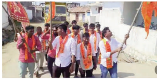
టైమ్స్ ఆఫ్ వార్త - నిజాంపేట మెడక్

మండలంలోని వివిధ గ్రామంలో విగ్రహం ఊరేగింపు ర్యాలీ