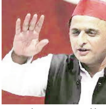
ఖరారు కాలేదని.. ఖరారు అయితేనే పార్టీ చేపట్టిన యాత్రలో పాల్గొంటానని తెలిపారు. సోమవారం సమాజ్ వాదీ పార్టీ అధ్యక్షుడు అఖిలేష్ యాదవ్ మాట్లాడుతూ.. పాక్షిక సంబంధించి ఇంకా చర్చలు కొనసాగుతున్నాయని, తమకు జాబితా అందిందని తెలిపారు. ఎంపీ సీట్లకు సంబంధించిన జాబితా కూడా ఇప్పుడు చెప్పారు. సీట్ల పంపకం ముగిసిన వెంటనే సమాజ్ వాదీ పార్టీ తమ న్యాయ యాత్రలో చేరుతుందని స్పష్టంచేశారు. కాగా.. అంతకుముందు అఖిలేష్ యాదవ్.. యూపీలోని 80 పార్లమెంట్ స్థానాల్లో 15 సీట్లను మాత్రమే కాంగ్రెస్ కు ఇచ్చేందుకు సుముఖంగా ఉన్నట్లు సమాచారం.. దీనిపై కాంగ్రెస్ నిర్ణయం తర్వాత.. తాను ఆలోచిస్తానని చెప్పినట్లు తెలుస్తోంది. ఇలా.. ఇండియా కూటమితో.. ఒక్కో రాష్ట్రంలో ఒక్కోచోట పరిస్థితి మారిపోయింది.. కీలక పార్టీలన్నీ షాకిస్తుండటంతో ఇండియా కూటమి ఉనికి ప్రశ్నార్థకంగా మారుతుంది.. అన్న సందేహాలు కూడా కలుగుతుండటం.. చర్చనియాంశంగా మారింది.

అఖిలేష్ యాదవ్ సంచలన ప్రకటన న్యూఢిల్లీ, ఫిబ్రవరి 19 : లోక్ సభ ఎన్నికలు సమీపిస్తున్న వేళ విపక్ష ఇండియా కూటమి వరుస షాకిలతో ఉక్కిరిబిక్కిరి అవుతోంది. వరుసగా ఒక్కొక్క పార్టీలు కూటమిని వీడతూండటం.. పలు పార్టీలు సీట్లపై తేల్చిచెప్పాలని నిలబేస్తుండటంతో కూటమి ఉనికి ప్రశ్నార్థకంగా మారుతోంది. ఇప్పుడికే.. ఇప్పుడికే.. కూటమిలోని కీలక నేత బీజేపీ నేతృత్వంలోని ఎన్ డిఎం కూటమితో జత కట్టగా.. సీట్ల విషయంలో విభేదాలు తలెత్తడంతో బెంగాల్ సీఎం మమతా బెనర్జీ కాంగ్రెస్ పార్టీపై ఫైర్ అయ్యారు. లోక్ సభ ఎన్నికల్లో బెంగాల్ లో కాంగ్రెస్ ను సీట్లు ఇవ్వబోమని ఒంటరిగా పోటీ చేస్తుమని ప్రకటించారు. కశ్మీర్ లో తమకు ఏ పార్టీతో పాటు ఉండదని స్పష్టం చేశారు. కేజ్రీవాల్ నేతృత్వంలోని ఆపి కూడా కాంగ్రెస్ తో అంటిమట్టకుండానే వ్యవహరిస్తూ ఒక్కోచోట అభ్యర్థులను ప్రకటిస్తూ వస్తోంది.. పంజాబ్ లోనూ కూటమితో సంబంధం లేకుండా ఒంటరిగా బరిలోకి దిగరామని ఆపి ఇప్పటికే ప్రకటించింది. ఈ క్రమంలోనే ఉత్తరప్రదేశ్ లో కూటమితో సంబంధం లేకుండా 16 మంది అభ్యర్థులతో తొలి జాబితాను ప్రకటించిన సమాజ్ వాదీ పార్టీ అధ్యక్షుడు అఖిలేష్ యాదవ్.. తాజాగా.. సంచలన వ్యాఖ్యలు చేసి ఇండియా కూటమిని మరోసారి ఇరకాటంలో పడేశారు. ప్రస్తుతం కాంగ్రెస్ ఆగ్రేసర్ రాహుల్ గాంధీ చేపట్టిన 'భారత్ జోడో' న్యాయ యాత్ర ఉత్తర ప్రదేశ్ లో కొనసాగుతోంది. ఈ తరుణంలో కాంగ్రెస్ 'భారత్ జోడో' న్యాయ యాత్రలో సమాజ్ వాదీ పార్టీ చేరడంపై ఆ పార్టీ అధినేత అఖిలేష్ యాదవ్ కీలక ప్రకటన చేశారు. సీట్ల పంపకం జరిగితేనే యాత్రలో పాల్గొంటానని తేల్చి చెప్పారు. సీట్ల పంపకం ఇంకా