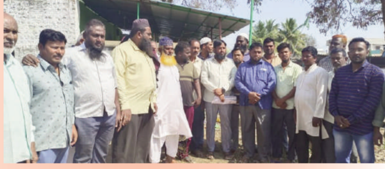
టైమ్స్ ఆఫ్ వార్త - కామారెడ్డి ప్రతినిధి