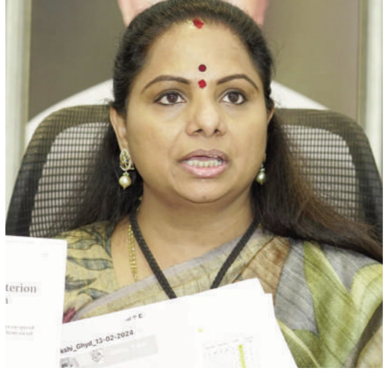
ఇంటి ఆడబిడ్డలకు తీవ్ర అన్యాయం చేస్తున్నదని బీఆర్ఎస్ ఎమ్మెల్సీ కల్పకుంట్ల కవిత ధ్వజమెత్తారు. ఉద్యోగవకాశాల్లో

రోస్టర్ పాయింట్లు రద్దు చేయడంతో ఆడబిడ్డలకు తీవ్ర నష్టం రోస్టర్ పాయింట్లు లేని హరిజాంటల్ రిజిస్ట్రేషన్లు దారుణం తక్షణమే జీవో 3ను వెనక్కి తీసుకోవాలి జీవోను ఉపసంహరించుకునేలా సీఎం రేవంత్ రెడ్డిని సోనియా గాంధీ ఆదేశించాలి బీఆర్ఎస్ ఎమ్మెల్సీ కల్పకుంట్ల కవిత వ్యాఖ్యలు సోనియా గాంధీ, మల్లికార్జున ఖర్జేకు ఎమ్మెల్సీ కవిత లేఖ బైమ్మి ఆఫ్ వార్ - నిజామాబాద్ జిల్లా ప్రతినిధి ఇందిరమ్మ రాజ్యం పేరిట అధికారంలోకి వచ్చిన కాంగ్రెస్ పార్టీ