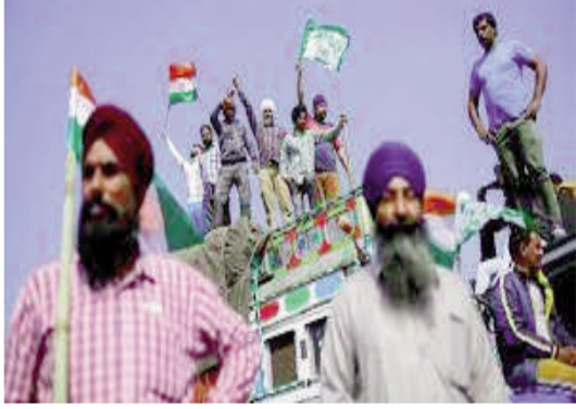
సాగుభూములు నిస్సారంగా మారకుండా ఉంటాయన్నారు. మరోవైపు ప్రభుత్వం చేసిన ప్రతిపాదనలపై రైతు నేత శర్వాన్ సింగ్ పంథేర్ స్పందించారు. ప్రభుత్వ ప్రతిపాదనల గురించి సోమ, మంగళవారాల్లో తాము మిగతా 10లో..

నిత్యానంద్ రాయ్, పంజాబ్ సీఎం భగవంత్ మాన్ రైతు నేతలతో చర్చలు జరిపారు. సమావేశం ఆనంతరం.. మంత్రి పీయూష్ గోయెల్ మీడియా సమావేశంలో వివరాలను వెల్లడించారు. రైతు సంఘాలతో రైతుల డిమాండ్లపై చర్చించామని, రైతులతో ఒప్పందం చేసుకున్న ఆనంతరం ఐదేళ్లపాటు పప్పుధాన్యాలు, మొక్కజొన్న, వత్తి పంటలను ప్రభుత్వ ఏజెన్సీలు కనీస మద్దతు ధరకు కొనుగోలు చేస్తాయని తమ బృందం రైతు సంఘాలకు ప్రతిపాదించినట్లు తెలిపారు. ముఖ్యంగా కందులు, మినుములు, మైసూర్ పప్పు, మొక్కజొన్న పండించే సాగుదారులతో ఎన్సీసీఎఫ్, ఎన్పీఎఫ్ కుడి వంటి సహకార సంఘాలు ఒప్పందాలు చేసుకుంటాయని, కొనుగోలు చేసేటప్పుడు వాటి పరిమాణంపై ఎలాంటి పరిమితి ఉండదని పేర్కొన్నారు. అందుకోసం ప్రత్యేకంగా ఒక పోర్టల్ ను కూడా ప్రారంభించమని మంత్రి పీయూష్ గోయెల్ వెల్లడించారు. రైతు సంఘాలకు తాము చేసిన ప్రతిపాదనలతో పంజాబ్ లో రైతుల వ్యవసాయానికి రక్షణ ఉంటుందన్నారు. అలాగే భూగర్భజలాలు మెరుగయ్యి..