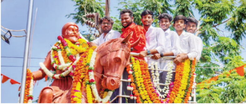
టైమ్స్ ఆఫ్ వార్త కామారెడ్డి ప్రతినిధి