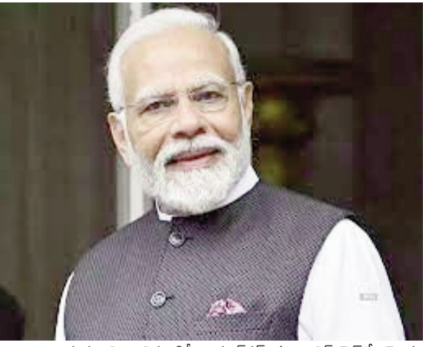
మధ్య నిర్మించిన ఢిల్లీ-అమృత్ సర్-కల్రా ఎక్స్ ప్రెస్ వే రెండు స్టాకేజీలతో పాటు ఇతర ముఖ్యమైన రహదారి ప్రాజెక్టులకు ఆయన శంకుస్థాపన చేస్తారు. జమ్మూలో కామన్ యూజర్ ఫెసిలిటీ పెట్రోలియం డిపోను అభివృద్ధి చేసే ప్రాజెక్టుకు కూడా ఆయన శంకుస్థాపన చేస్తారు. దీని వ్యయం సుమారు రూ. 677 కోట్లు.

దేశవ్యాప్తంగా విద్యును ప్రోత్సహించేందుకు పలు విద్యాసంస్థలకు శంకుస్థాపన చేయడమే కాకుండా ఇతర ప్రాంతాల్లో నిర్మించిన సంస్థలను కూడా ఆయన ప్రారంభిస్తారు. ఇందులో దాదాపు రూ. 13,375 కోట్ల విలువైన పలు ప్రాజెక్టులకు ప్రధాని ప్రారంభోత్సవం, శంకుస్థాపన చేయనున్నారు. దేశంలో మూడు కొత్త ఐఐఐఎలు అంటే ఐఐఐఐ జమ్మూ, ఐఐఐఐ బోధ్ గయా, ఐఐఐఐ విశాఖపట్నంలను జమ్మూ నుంచి ప్రారంభించనున్నారు. కేంద్రీయ విద్యాలయానికి సంబంధించి 20 కొత్త భవనాలు, దేశవ్యాప్తంగా 13 కొత్త సహాయ విద్యాలయ భవనాలను కూడా ఆయన ప్రారంభించనున్నారు. ఇవి కాకుండా, ఇతర సంస్థల కూడా ప్రారంభించనున్నారు. దేశవ్యాప్తంగా విద్యార్థుల విద్యా అవసరాలను తీర్చడంలో ఇది ఒక ముఖ్యమైన దశగా పరిగణించబడుతుంది. ఇదిలా ఉండగా, జమ్మూ విమానాశ్రయంలో కొత్త టెర్మినల్ భవనానికి కూడా ప్రధాని శంకుస్థాపన చేయనున్నారు. ఈ కొత్త టెర్మినల్ 40 వేల చదరపు మీటర్లలో విస్తరించి ఉంది. ఇందులో సుమారు 2000 మంది ప్రయాణికులకు సేవలను అందించవచ్చు. దీనితో పాటు, ఈ టెర్మినల్ లో ఆధునిక సౌకర్యాల కూడా ఉంటాయి. ఈ కార్యక్రమంలో జమ్మూ : కల్రా