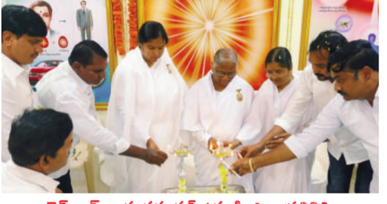
టైమ్స్ ఆఫ్ వార్త-వరంగల్ ఉమ్మడి జిల్లా ప్రతినిధి:

అందరూ ఎల్లప్పుడూ పరమాత్మ పాలనలో పాలింపబడాలి పాలింపబడాలి అలౌకిక ధైవి సాధనములు సవిత, శాంతి అక్కర్లు