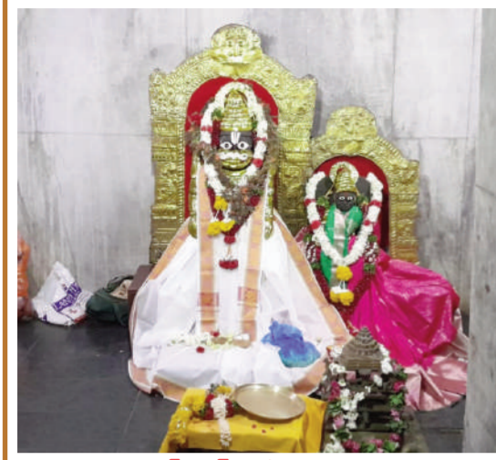
టైమ్స్ ఆఫ్ వార్త - ఎడవల్లి