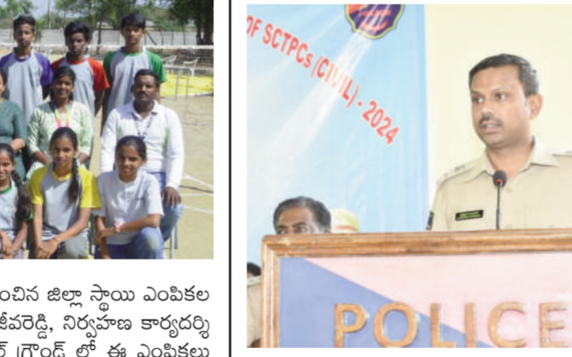
టైమ్స్ ఆఫ్ వార్త - ఎడవల్లి