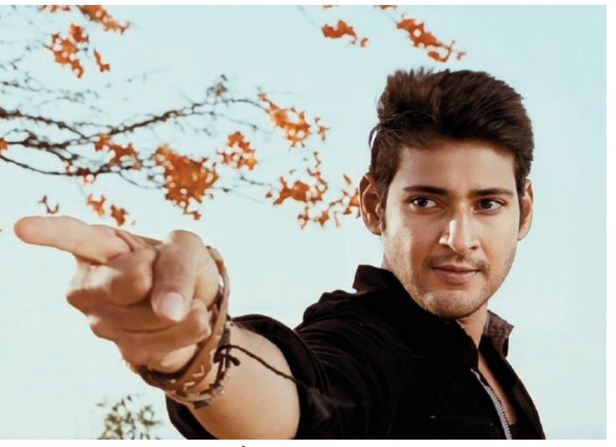
రాజమౌళి ఈసారి తన టెక్నికల్ థీమ్ లో కొన్ని మార్పులు చేయనున్నాడని అంటున్నారు. దాంతో సినిమాలో క్యూరియాసిటీ మరింత పెరిగింది.

కొత్త సినిమా కోసం మహేష్ బాబును కొత్తా చూపాలని స్టార్ డైరెక్టర్ రాజమౌళి యోచిస్తున్నారు. అందుకోసం మహేష్ బాబును కేవలం షూటింగ్ కే పరిమితం చేయాలని, బయట కనపకుండా చూడాలని అనుకుంటున్నాడట. అందుకే అతను ఇక పబ్లిక్ గా కనిపించరాదని ఆంక్షలు పెట్టారని టాక్ నడుస్తోంది. మహేష్ బాబు ఎలాంటి ఈవెంట్స్ కు కానీ, మూవీ ఫంక్షన్స్ కు జోడారుకాకూడదని ఆదేశాలు జారీ చేశారట. ఇప్పుడు ఇదే న్యూస్ టాలీవుడ్ లో చక్కర్లు కొడుతుంది. ఇకపై మహేష్ బాబు పబ్లిక్ గా కనిపించకూడదని ఎన్ ఎస్ రాజమౌళి చెప్పి నట్లు టాక్ వినిపిస్తుంది. మహేష్ బాబు, రాజమౌళి కాంట్రాక్టులో సినిమా రాబోతున్న విషయం తెలిసింది.. ఈ సినిమా కోసం మహేష్ బాబు అభిమానులు ఎంతో ఆత్రుతగా ఎదురుచూస్తున్నారు. ఈ మూవీ ప్రీ ప్రొడక్షన్ పనులు శరవేగంగా జరుగుతున్నాయి. ఈ సినిమా పాత్ర కోసం మహేష్ బాబు గెటప్ మార్చుకున్నాడు. అలాగే బాడీ బిల్డింగ్ కూడా చేయబోతున్నాడు. ఆయన కొత్త గెటప్ ఎలా ఉంటుందో జనాలకు తెలియకూడదు. అందుకే మహేష్ బాబు పబ్లిక్ గా కనిపించవద్దని రాజమౌళి రూల్ పెట్టారని టాక్. మిగతా దర్శకులతో పోలిస్తే రాజమౌళి వర్క్ సైల్ చాలా డిఫరెంట్ గా ఉంటుంది. జక్కన్న సినిమాలు తీయడానికి చాలా సమయం తీసుకుంటాడు. అందుకు తగ్గట్టుగానే హీరోల లుక్స్ ను కూడా మార్చుకుంటారు ఇప్పుడు మహేష్ బాబు లుక్ ను కూడా మార్చుకుంటారు దర్శకుడు రాజమౌళి. అందుకు తగ్గట్టుగానే మహేష్ బాబు విదేశాలకు వెళ్లి మరీ శిక్షణ పొందుతున్నాడు. మహేష్ బాబు నటించిన 'గుంటూరు కారం' సినిమా హిట్ అయినా కూడా అది మహేష్ బాబు అభిమానులకు ఆశించిన స్థాయిలో టికెట్ ఇవ్వలేకపోయింది. ఈ సినిమాపై అభిమానుల్లో భారీ అంచనాలు ఉన్నాయి. ఈ సినిమా మహేష్ బాబు కెరీర్ లోనే గస్ట్ మూవీగా నిలవనుంది.