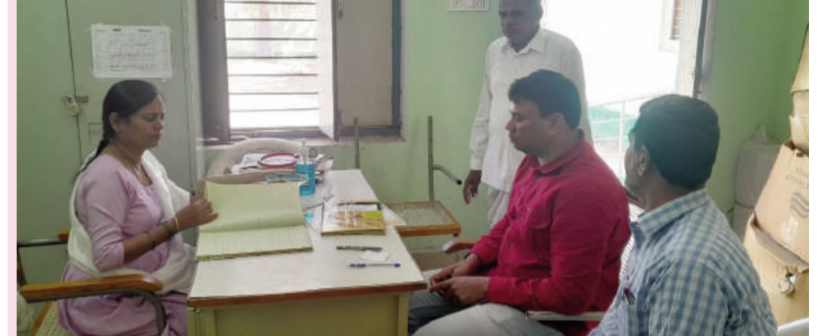
టైమ్స్ ఆఫ్ వార్త - ఎడవల్లి