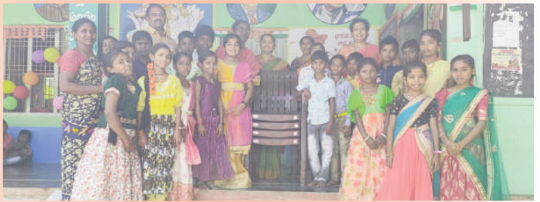
టైమ్స్ ఆఫ్ వార్త - చింతకాని