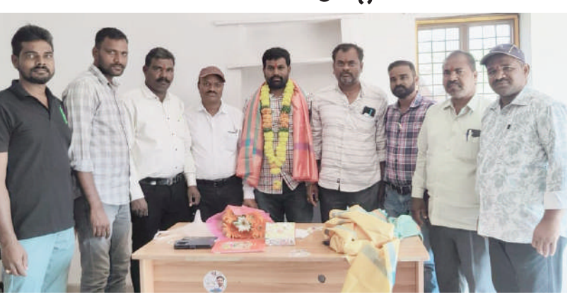
తైమ్స్ ఆఫ్ వార్త కామారెడ్డి ప్రతినిధి