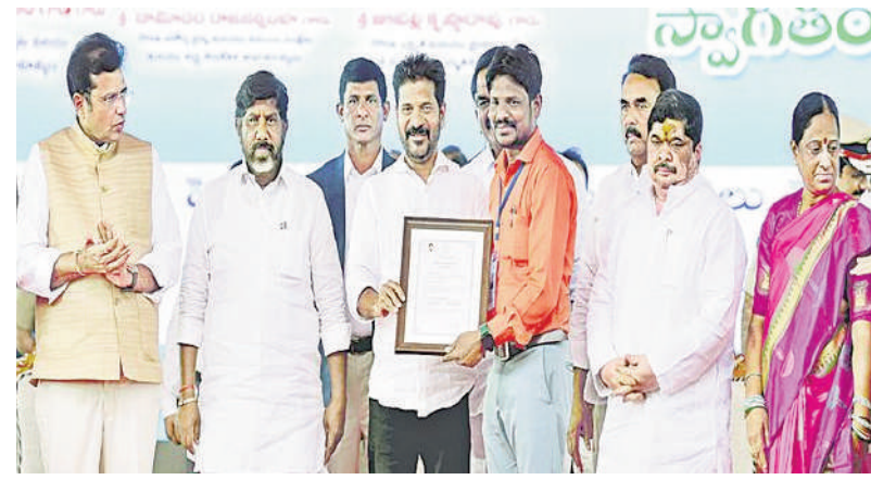
గ్రామాల్లోకి వెళ్లి చర్చించాలని కోరారు.

చేయాలన్నట్టు ప్యూడల్ వర్షతో బీఆర్ఎస్ పాలన కొనసాగిందని విమర్శించారు. ఆ విధానంలో మార్పు రావాలి, పేదవాని జీవితం మార్చాలి అందుకు విద్యే సరైన మార్గమని రేవంట్ అభిప్రాయపడ్డారు. మనవడి పెంపుడు కుక్క చనిపోతే పశువైద్యుని మీద కేసు పెట్టిన మాజీ సీఎం కేసీఆర్, ఆయన ప్రభుత్వంపై పేదరికే బీజేపీ కారణంగా ప్రాణాలు కోల్పోయిన ఆడబిడ్డల వక్షాన ఏం చేశారని ప్రశ్నించారు. పెంపుడు కుక్కనే కేసు పెడితే ఆడబిడ్డ చావుకు కారణమైన వారిని ఉరి తీయాలని వ్యాఖ్యానించారు. ఉద్యోగాల కోసం తెలంగాణ తొమ్మిది ముడుకా ఆకాంక్షలను బీఆర్ఎస్ నేరవేర్చలేదని, పైపెచ్చు కనీసం ఆ విషయాన్ని అడిగేందుకు కూడా అవకాశమివ్వలేదని గుర్తుచేశారు. అందుకే యువత ఆ నలుగురి (కేసీఆర్, కేటీఆర్, హరీష్ రావు, కవిత)ని కొలువుల నుంచి తొలగించారని ఎద్దేవా చేశారు. అలా తొలగించినందుకే ఇప్పుడు వేలాది మంది యువతకు ఉద్యోగాలు వచ్చాయని చెప్పారు. ఇదే స్ఫూర్తితో రాజోయే కాలంలో కూడా తీర్పు ఇవ్వాలని కోరారు. యుధా రాజా శ్రద్ధా ప్రజా అన్నట్టు కాంగ్రెస్ ప్రజా ప్రభుత్వం వచ్చాక ఉద్యోగ నియామకాల ప్రక్రియలో అడ్డంకులు లేకుండా ఉండేందుకు అధికారులు చాలా కష్టపడ్డాడని కితాబిచ్చారు.