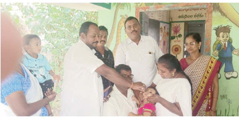
టైమ్స్ ఆఫ్ వార్త చింతకాని