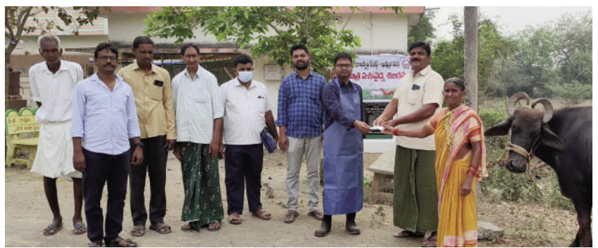
టైమ్స్ ఆఫ్ వార్త - టోనకల్