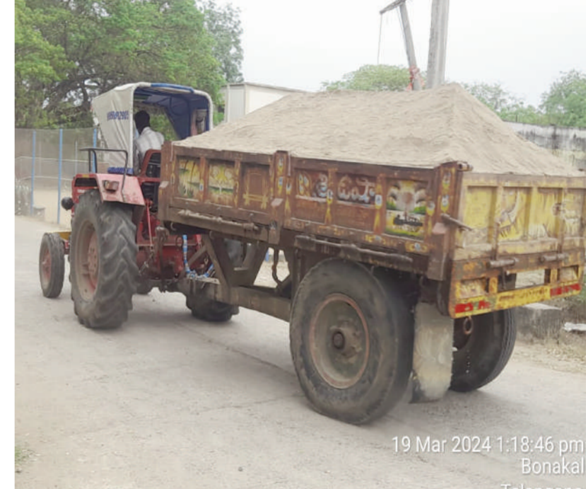
19 Mar 2024 1:18:46 pm Bonakal Telangana