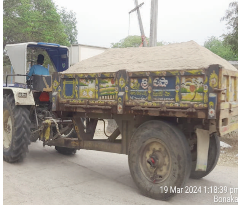
19 Mar 2024 1:18:39 pm Bonakal