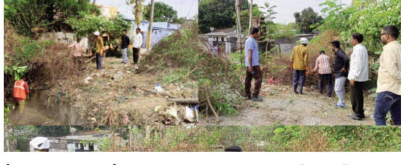
చేశారు. సమస్యలపై తక్షణమే స్పందించి, వాటిని పరిష్కరించిన మున్సిపల్ కమిషనర్ కు ఏరియా ప్రజలు హార్షం వృక్షం చేస్తూ, ధన్యవాదాలు తెలిపారు.