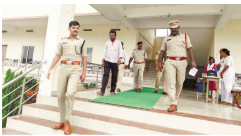
టైమ్స్ ఆఫ్ వార్త - మహబూబాబాద్ జిల్లా ప్రతినిధి