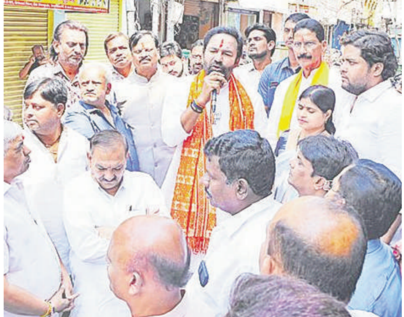
టైమ్స్ ఆఫ్ వార్త - హైదరాబాద్ :

తెలంగాణలో మెజార్టీ ఎంపీ సీట్లను బీజేపీ గెలుచుకుంటుందని కేంద్రమంత్రి, బీజేపీ ర్యక్తమం ప్రారంభమైందని, తెలంగాణ లో మంత్రి సరేంద్ర మోదీతో సహా కేంద్ర హోంమంత్రి అమిత్ షా ఇప్పటికే రాష్ట్ర హోంమంత్రి అమిత్ షా లింగ్ బూత్ పర్యటనలతో ప్రజల సుంచి సానుకూల స్పందన వచ్చిందన్నారు. బుధవారం ఆయన సికింద్రాబాద్ పార్లమెంట్ పరిధిలోని సనత్ సంగర్ నియోజకవర్గం రాంగోపాల్ పేట, పానీబజార్, రాణిగంజ్, ప్యాట్నీ, కళాసీ గూడ, ఓల్డ్ బోయిగూడ, నాలాబజార్, మోం దా మార్కెట్ బస్టీల్లో పర్యటించిన అనంతరం మీడియాతో మాట్లాడారు. పార్లమెంట్ ఎన్నికల్లో రాష్ట్రంలో డబుల్ డిజిటీ సీట్లను గెలుస్తామని ధీమా వ్యక్తం చేశారు. దేశ వ్యాప్తంగా లోక్ సభ ఎన్నికల ప్రచారం కా ర్యక్తమం ప్రారంభమైందని, తెలంగాణ లో నిర్వహించిన ఐదు బీజేపీ కార్యక్రమాల్లో హోంమంత్రి అమిత్ షా ఇప్పటికే రాష్ట్ర హోంమంత్రి అమిత్ షా లింగ్ బూత్ పర్యటనలతో ప్రజల సుంచి సానుకూల దిశా నిర్దేశం చేశారని చెప్పారు. భారీ బహిరంగ సభలో కాకుండా ఇంటింటికి వెళ్లి ప్రజలను కలిసి మాట్లాడాలని నిర్ణయించామని వెల్లడించారు. కాశ్మీర్ సుంచి కన్యాకు మారి వరకు మోదీ ప్రభుత్వం రావాలని ప్రజలు కోరుకుంటున్నారని తెలిపారు.