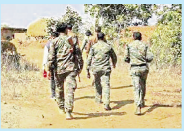
టైమ్స్ ఆఫ్ వార్త - హైదరాబాద్ :