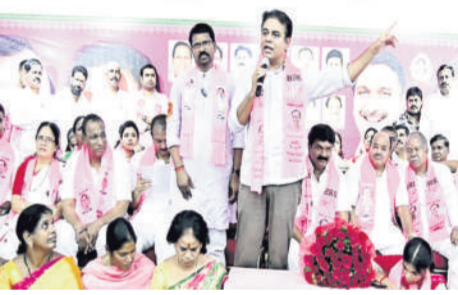
టైమ్స్ ఆఫ్ వార్త - హైదరాబాద్ :