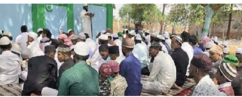
టైమ్స్ ఆఫ్ వార్త-బిక్కునూర్

రంజాన్ పర్వదినం సందర్భంగా బస్సుపూర్ లో ముస్లింలు భక్తి శ్రద్ధలతో స్థానిక ఈడ్లా వద్ద ప్రత్యేక సమాజులు ఆచరించారు. నిన్ను నెలవంక కనిపించడంతో నేడు ఈద్ ఉల్ ఫి తార్ జరుపుకున్నారు. గత 30 రోజులుగా ఉపవాస దీక్షలు విజయవంతంగా పూర్తి చేసిన వారు నెలవంకను చూసి సంబరాలు నిర్వహించారు. సమాజుల అనంతరం ఒకరికొకరు ఈద్ ముబారక్ శుభాకాంక్షలు తెలుపుకుంటూ అలింగనం చేసుకున్నారు. ప్రజలందరూ సుఖాంతలతో ఉండాలని కోరారు.