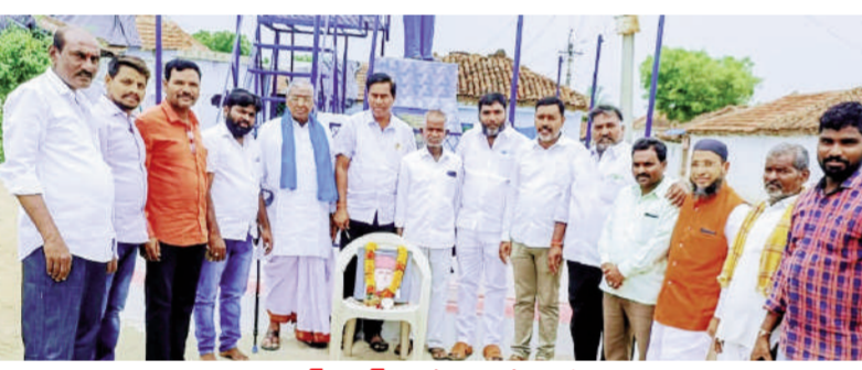
టైమ్స్ ఆఫ్ వార్త - బాస్సువాడ: