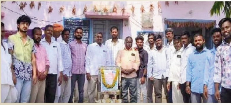
టైమ్స్ ఆఫ్ వార్త-బిక్కునూర్