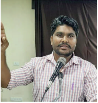
టైమ్స్ ఆఫ్ వార్త - నిజామాబాద్ సీట్