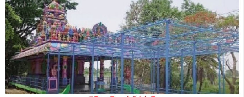
టైమ్స్ ఆఫ్ వార్త - విక్రమూర్

విక్రమూర్ మండల కేంద్రంలో బుధవారం నుంచి ఐదు రోజులపాటు పెద్దమ్మ ఉత్సవాలు నిర్వహించనున్నట్లు పట్టణ మునిసిపల్ సంఘం ప్రతినిధులు తెలిపారు. ఉత్సవాలను పురస్కరించుకొని ఆలయాన్ని సుందరంగా అలంకరించినట్లు పేర్కొన్నారు. ఈ 19 న ఆలయం వద్ద అమ్మవారి కల్యాణం అంగారం వైభవంగా నిర్వహిస్తున్నట్లు చెప్పారు. భక్తులు పెద్ద ఎత్తున తరలి రావాలని వారు కోరారు.