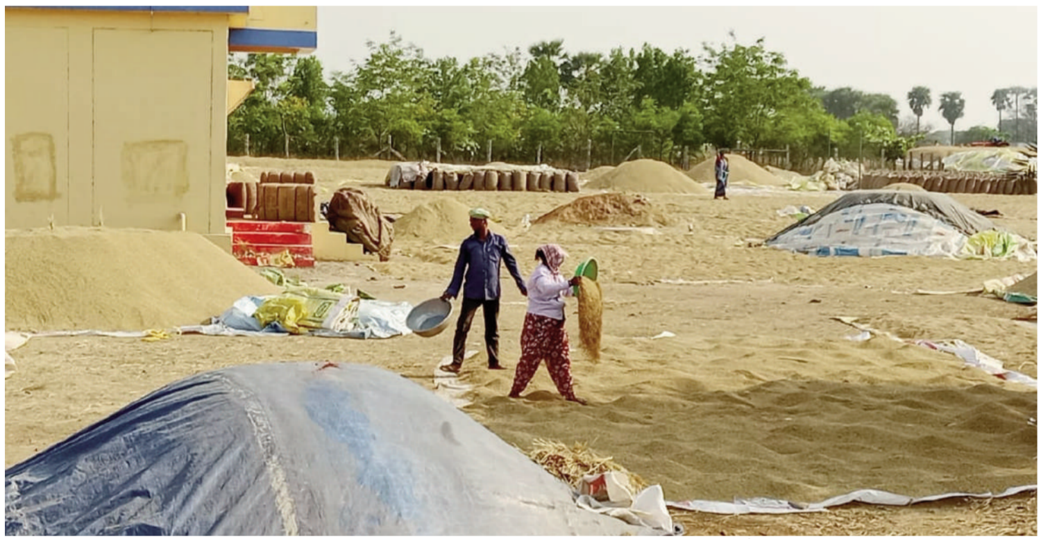
రైతుల ధాన్యం పోయడానికి పట్టాలు లేవు ధాన్యం శుభ్రం చేయడానికి ప్యాడి క్లీనర్లు లేవు పనిచేయని ప్యాడి క్లీనర్లు ఇచ్చి చేతులు దులుపుకున్న అధికారులు

టైమ్స్ ఆఫ్ వార్త - సూర్యాపేట జిల్లా ప్రతినిధి