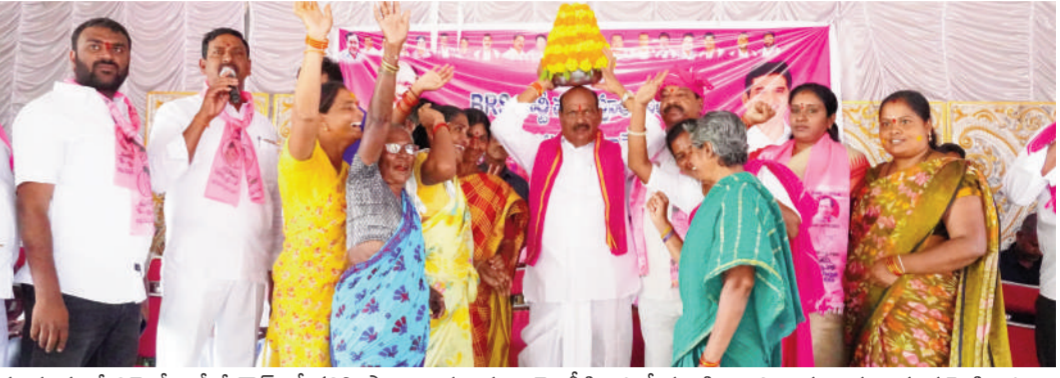
టైమ్స్ ఆఫ్ వార్త - నిజామాబాద్ జిల్లా ప్రతినిధి