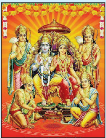
పాఠకులు, ప్రకటనకర్తలు, ఏజెంట్లు, శ్రేయోజిలాఫులకు 'టైమ్స్ ఆఫ్ వార్త' శ్రీరామ నవమి శుభాకాంక్షలు