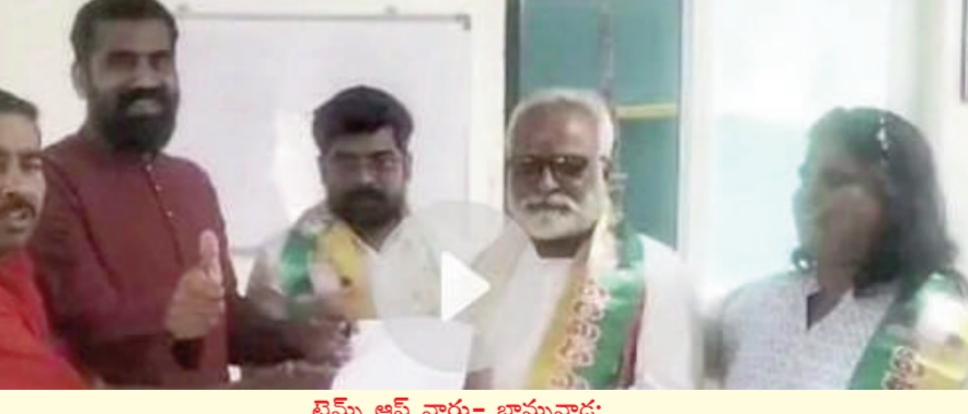
టైమ్స్ ఆఫ్ వార్త - బాన్సువాడ: