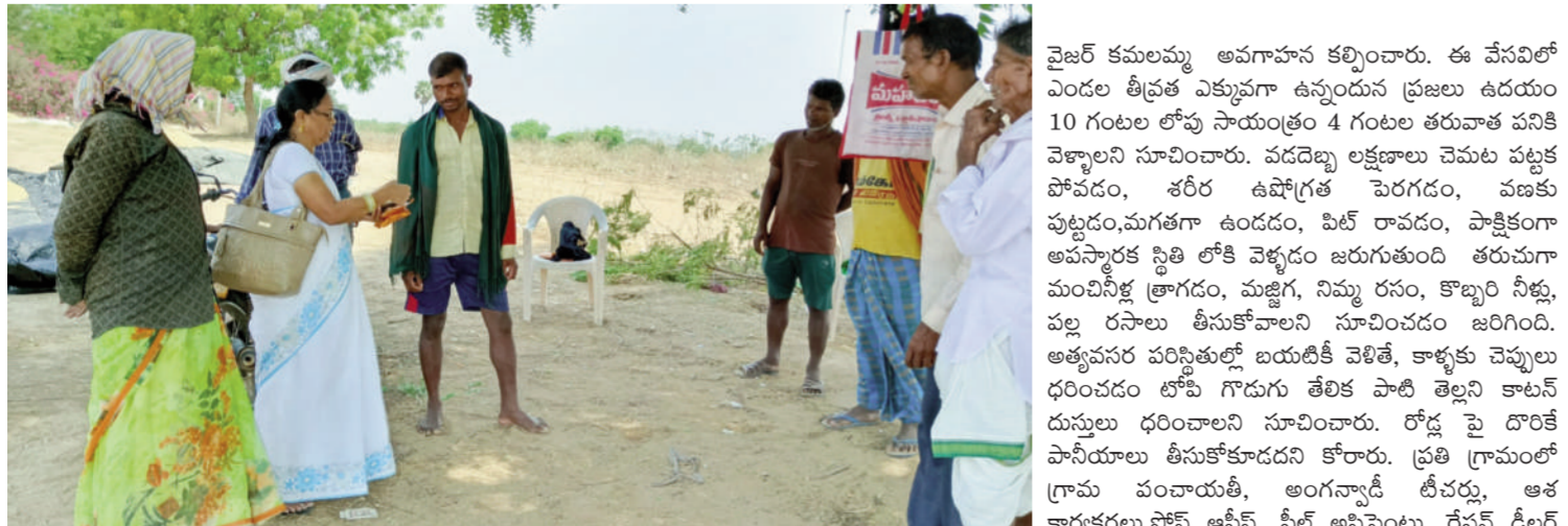
టైమ్స్ ఆఫ్ వార్త మోతె