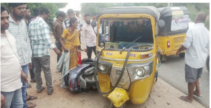
ఓవైపు ఆఫ్ వార్త - ఎడపల్లి

ఎడపల్లి మండలంలోని అలీసాగర్ పంపుహౌస్ వద్ద సోమవారం సాయంత్రం ఆటో స్కూటీ డీకొన్న ఘటనలో ఐదుగురికి గాయాలయ్యాయని తెలిసింది.