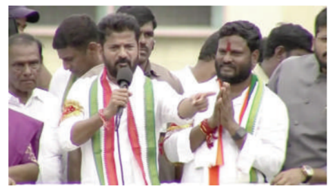
పాటు అమిత్ షా వస్తారని పేర్కొన్నారు.