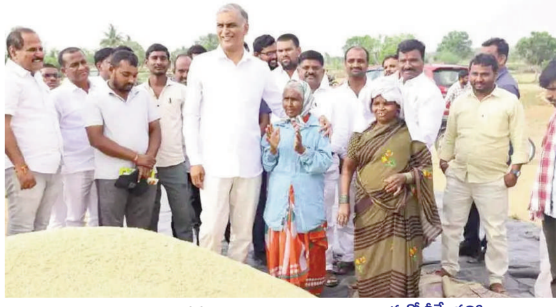
నా ఎత్తుతో నీకేం పని? చెప్పారు. ఇలాంటి అబద్ధాలు మాట్లాడడంలో రేవంత్ కు ఆస్పర్ అవార్డు ఇవ్వాలని ఎద్దేవా చేశారు.

నవ్ టచ్ చేయాల్సింది మా ఎమ్మెల్యేలను కాదు.. బాధల ఉన్న రైతులను టచ్ చెయ్యాలి. అరు గ్యారెంటీలను టచ్ చెయ్యాలి. అని సీఎం రేవంత్ రెడ్డికి మాజీ మంత్రి, సిద్దిపేట ఎమ్మెల్యే హరీష్ రావు హితవు పలికారు.