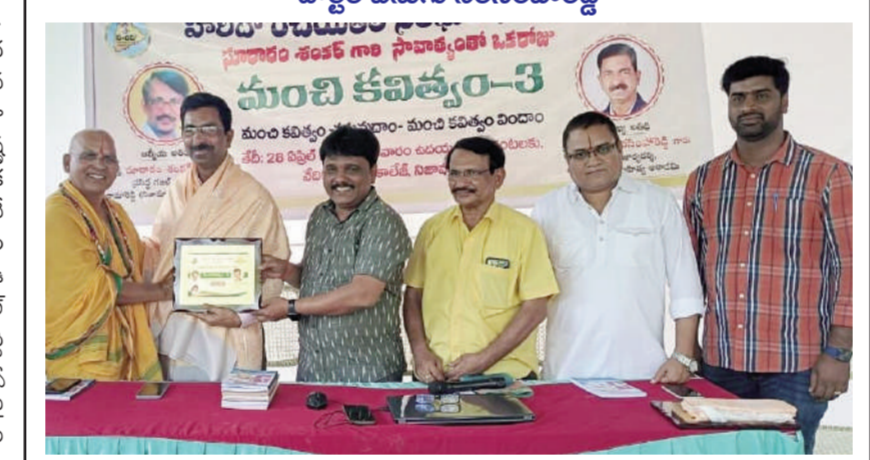
టైమ్స్ ఆఫ్ వార్త - నిజామాబాద్ సిటీ