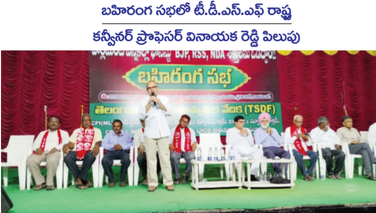
టైమ్స్ ఆఫ్ వార్త - నిజామాబాద్ సిటీ