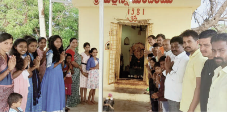
టైమ్స్ ఆఫ్ వార్త-భోధన్