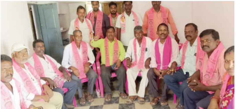
బిఆర్ఎస్ గ్రామ శాఖ ఆధ్వర్యంలో సమావేశం ఏర్పాటు