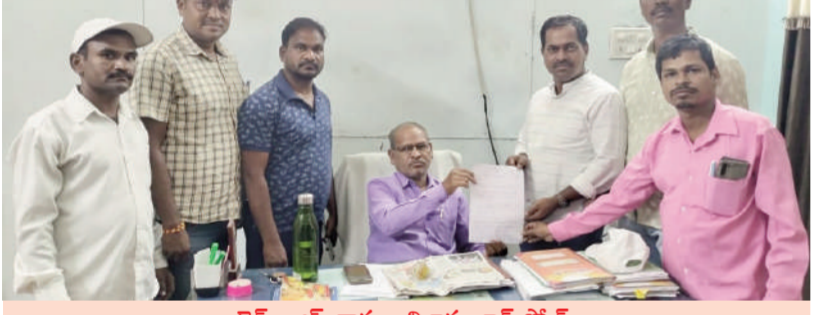
టైమ్స్ ఆఫ్ వార్త - నిజామాబాద్ సెన్టర్

ప్రతి సంవత్సరం జిల్లా యువజన క్రీడల శాఖ అధ్యక్షులలో నిర్వహించే వేసవి శిక్షణ శిబిరాల సంఖ్యను పెంచాలని కోరుతూ వివిధ క్రీడాశాల శిక్షకులు జిల్లా యువజన క్రీడల అధికారి ముత్తన్నకు వినతి పత్రం అందజేశారు. గతంలో 20కి పైగా ఉండే శిక్షణ శిబిరాలు ఇప్పుడు కేవలం 10 కే పడిపోయాయని దీంతో వివిధ క్రీడాశాలలో క్రీడాకారులు ఎంతో సమస్యలున్నారని అన్నారు. కేవలం వేసవిలోనే శిక్షణకు అవకాశం ఎక్కువగా ఉంటుందన్నారు. అంతేకాకుండా క్రీడాకారుల్లో ఆసక్తి, క్రీడలపై మక్కువ కలిగి ఇదే సమయంలో అని వారు పేర్కొన్నారు. భావిపరాలకు ఈ వేసవి శిక్షణ శిబిరాలు ఎంతో దోహదపడతాయని తెలిపారు. ఇది ఇలా ఉండగా ఇతర జిల్లాలలో 20 కి పైగా శిక్షణ శిబిరాలు నిర్వహిస్తున్నారని, మున్సిపల్ కార్పొరేషన్ కమిషనర్ చొరవతో, దాతల సహకారంతో, గ్రామాభివృద్ధి కమిటీలతో ఎన్నో క్రీడాశాలలో వేసవి శిక్షణ శిబిరాలు కొనసాగుతున్న అన్నారు. కానీ నిజామాబాద్ జిల్లాలో మాత్రం దశాబ్దాలుగా వేళ్ళ సంఖ్య లోనే శిక్షణ శిబిరాలు జరగడం కోపనీయమన్నారు. ఆసక్తి ఉన్న శిక్షకులు ఆసక్తి ఉన్న క్రీడాకారులు ఉన్నప్పటికీ సంబంధిత శాఖ తరఫున పూర్తి సహకారం ప్రోత్సాహం అందకపోవడంతో పలు క్రీడాశాల నిరుత్సాహం లోకి కృంగిపోతున్నారన్నారు. ఈ విషయంలో సంబంధిత క్రీడల అధికారి, జిల్లా అధికారి యంత్రాంగం చొరవ తీసుకొని వేసవి శిక్షణ శిబిరాల లో నిర్వహించే క్రీడాశాల సంఖ్యను పెంచి క్రీడారంగా అభివృద్ధికి తోడ్పడాలని వారు కోరారు. ఈ కార్యక్రమంలో శిక్షకులు గంగ మోహన్, శ్యామ్, రాజ్ కుమార్, యాదగిరి తదితరులు పాల్గొన్నారు.