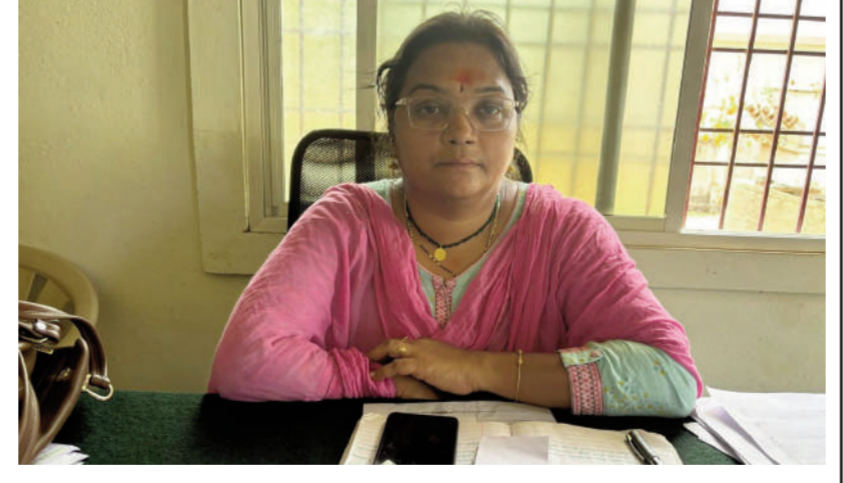
టైమ్స్ ఆఫ్ వార్త - బోనకల్