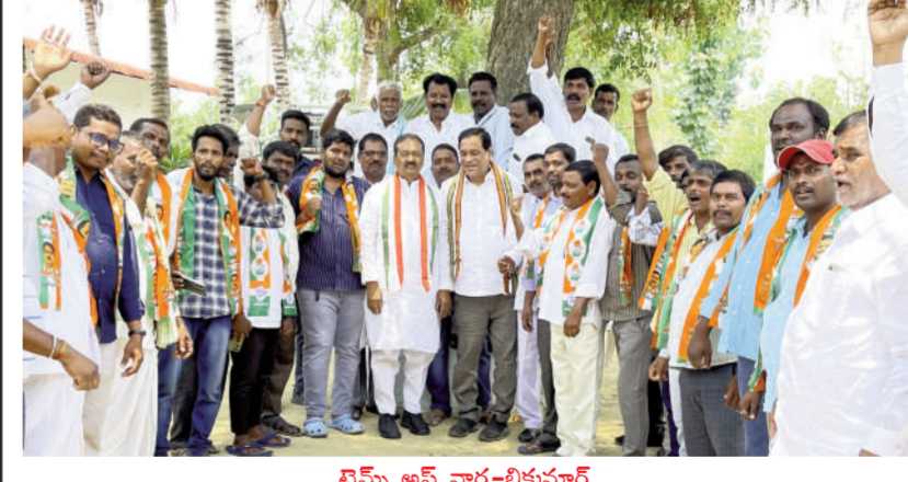
టైమ్స్ ఆఫ్ వార్త-భిక్షాపూర్