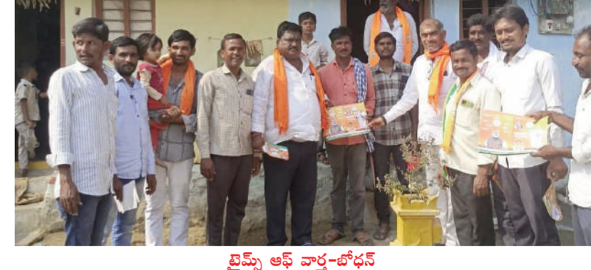
టైమ్స్ ఆఫ్ వార్త-బోధన్