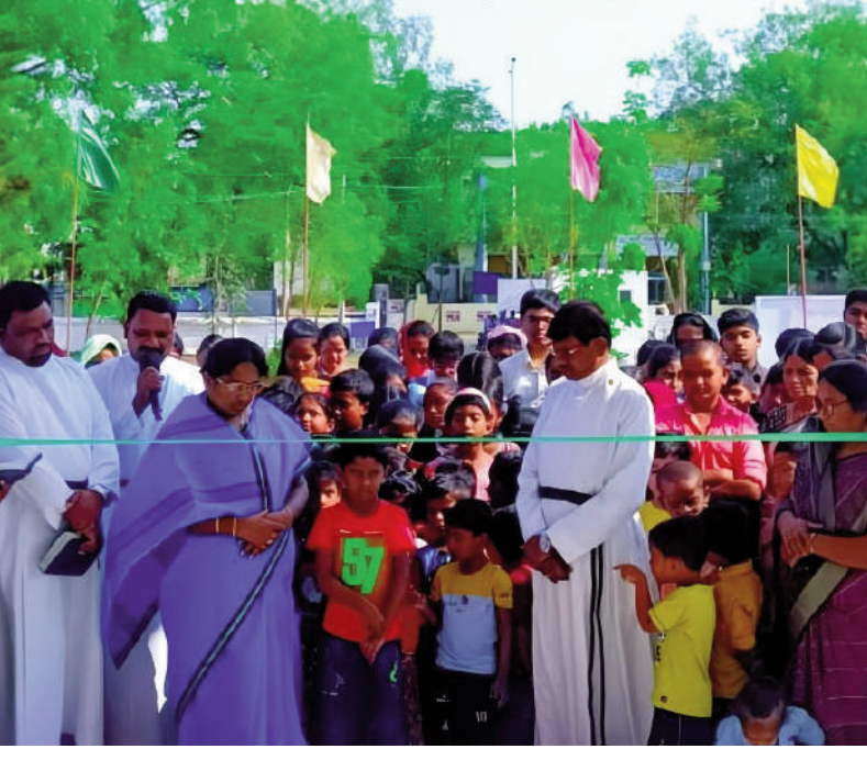
టైమ్స్ ఆఫ్ వార్త - మెండోర