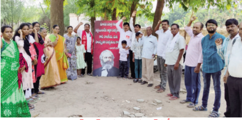
టైమ్స్ ఆఫ్ వార్త - నిజామాబాద్ సీట్