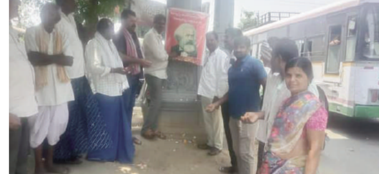
టైమ్స్ ఆఫ్ వార్త-ఉమ్మడి వరంగల్ జిల్లా: