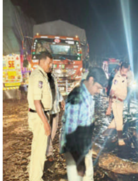
టైమ్స్ ఆఫ్ వార్త-వరంగల్ జిల్లా: