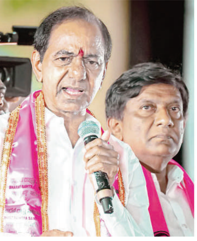
సహా పార్టీ నాయకులు పాల్గొన్నార.

మొన్నటి ఎన్నికల్లో ఆరు గ్యూరంటీలు కలిపి మరో 420 హామీలు ఇచ్చి అధికారంలోకి వచ్చిన కాంగ్రెస్ పనితీరు ఏదో ఈ బయ్యలెల కాలంలోనే తేలిపోయింది దని కేసీఆర్ అన్నారు.