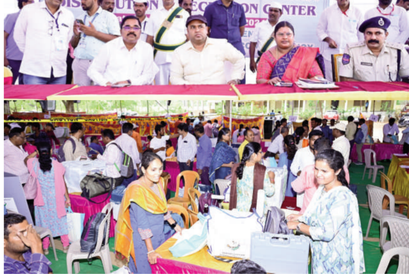
టైమ్స్ ఆఫ్ వార్త మెదక్ జిల్లా ప్రతినిధి

పాడగించిన ఎన్నికల కమిషన్ జిల్లా కలెక్టర్ జిల్లా ఎన్నికల అధికారి రామలూజ్ ఎన్నికల సామగ్రి పంపిణీ ప్రక్రియను క్షేత్ర స్థాయిలో పరిశీలించిన జిల్లా కలెక్టర్ జిల్లా ఎన్నికల అధికారి