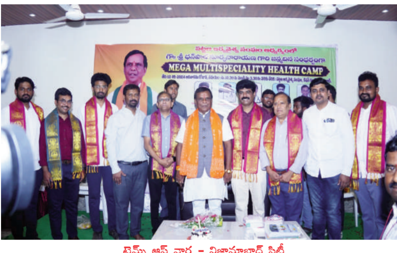
టైమ్స్ ఆఫ్ వార్త - నిజామాబాద్ సీట్