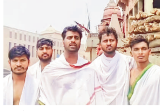
మోసుకోస్తుంది. వెంటనే అంత్యక్రియలకు సర్వం సిద్ధం చేస్తారు. ఏ మతమైతే ఆ సంప్రదాయ పద్ధతిగా నిర్వహిస్తారు. వారిని చూస్తే వారి దగ్గర వారు ఏవైనా పోయారేమి అని

అవదలో ఉన్న వారికి సాయం చేయడం మానవత్వం. తెలిసిన వారికి సాయం పడటం మంచివనం. మరీ మరణించిన వ్యక్తి ఎవరో. ఎక్కడ వారో అనాధా తపస్వ చాలిస్తే మరణించింది మనలాంటి మనుషులేని, అందరూ మనవాళ్ళేనని అతిమ సంస్కారం ఆత్మీయంగా చేయడం నిజంగా కరుణతత్వం. దేహం విడిచిన జీవిత అక్కను చేర్చుకునే అపార దైవత్వం మానవత్వమే. నిజమైన దైవత్వంగా భావిస్తూ అనాధ శవాలకు అతిమ సంస్కారాలు నిర్వహిస్తుంది ఇందూరు యువత స్వచ్ఛంద సేవా సంస్థ. ఇప్పటికి 104 అనాధ శవాలకు అంత్యక్రియలు నిర్వహించారు. వారి మెల్లెట్ ఎక్కువ చావు కబుర్లే