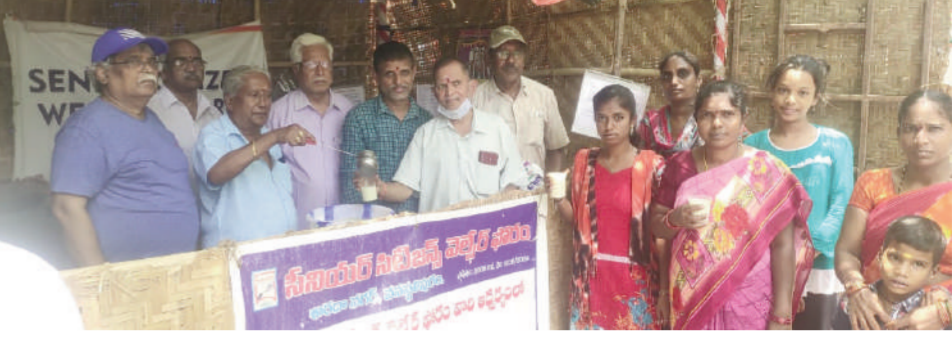
ఓమ్మి ఆఫ్ వార్త - ఎల్పీసగర్ ప్రతినిధి: