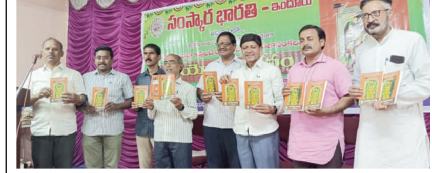
టైమ్స్ ఆఫ్ వార్త - నిజామాబాద్ కలెక్టరేట్