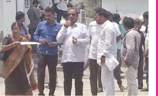
సంఘటన జరిగిన మరుసటి రోజు సుమారు 12 గంటలకు ఆసుపత్రి చేరుకున్న సూపరింటెండెంట్ నాయక్