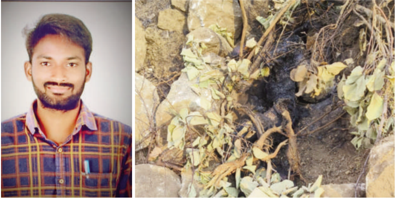
టైమ్స్ ఆఫ్ వార్త - సూర్యాపేట జిల్లా ప్రతినది