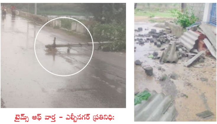
టైమ్స్ ఆఫ్ వార్త - ఎట్టిసగర్ ప్రతినది

నేల కూలిన విద్యుత్ స్తంభాలు, వృక్షాలు, భారీ హోర్డింగులు జనజీవనం అస్తవ్యస్తం