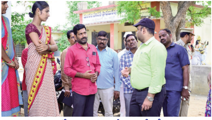
పనుల్లో అలసత్వం ప్రదర్శిస్తే సహించేది లేదు