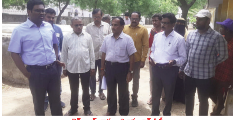
టైమ్స్ ఆఫ్ వార్త - నిజామాబాద్ సీట్

పాఠశాలల్లో మౌలిక వసతులను మెరుగుపర్చేందుకు వీలుగా అమ్మ ఆదర్శ పాఠశాల కమిటీల ఆధ్వర్యంలో చేపడుతున్న పనులను నాణ్యతతో పూర్తి చేయించాలని కలెక్టర్ రాజ్ గాంధీ హనుమంతు అధికారులకు సూచించారు. నిజామాబాద్ జిల్లా కేంద్రంలోని అర్బుపల్లిలో గల ప్రభుత్వ ఉన్నత పాఠశాలను కలెక్టర్ శనివారం సందర్శించి పనులను పరిశీలించారు. తరగతి గదులు, కిచెన్ షెడ్, నీటి సరఫ్ఫ తదితర చౌక్య కొనసాగుతున్న పనులను తనిఖీ చేసి, అధికారులను వివరాలు అడిగి తెలుసుకున్నారు. అవసరమైన పనులను మాత్రమే చేపట్టి పూర్తి చేసేలా చర్యలు తీసుకోవాలని కలెక్టర్ సూచించారు. అన్ని పాఠశాలలను సందర్శిస్తూ, పనులు తీరును నిశితంగా పరిశీలించాలని జిల్లా విద్యాశాఖ అధికారి దుర్గాప్రసాద్ ను ఆదేశించారు. పాఠశాలలు తెరువకునే సమయం నాటికి అన్ని పనులు పూర్తి చేయించాలన్నారు. క్షేత్రస్థాయిలో ఎక్కడైనా చిన్నచిన్న సమస్యలు తలెత్తితే వాటిని వెంటనే పరిష్కరించాలని, పనులకు అటంకాలు ఏర్పడకుండా చూడాలన్నారు. ప్రతి పాఠశాలలో నీటివసతి, టాయిలెట్స్ తప్పనిసరి ఉండాలని, బడి అవరణను శుభ్రం చేయించాలని అన్నారు. కలెక్టర్ వెంట సంబంధిత అధికారులు ఉన్నారు.