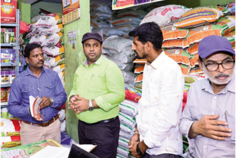
నార్సింగ్ మండల కేంద్రంలో లోని