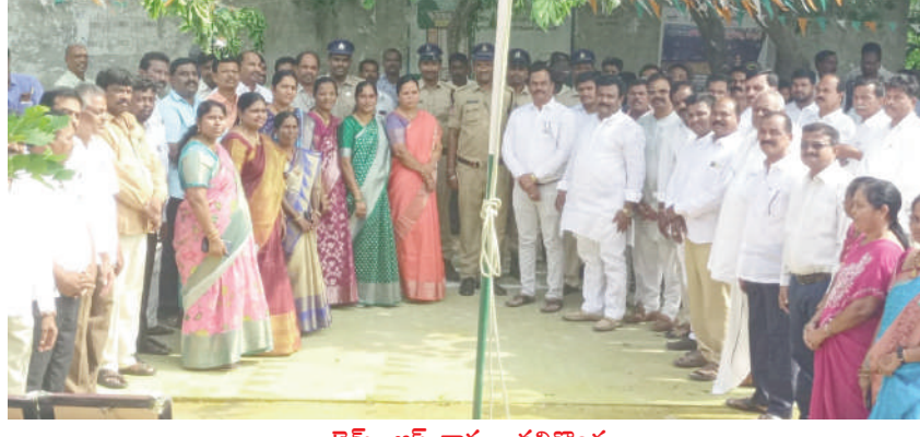
టైమ్స్ ఆఫ్ వార్డు - చలిగండ