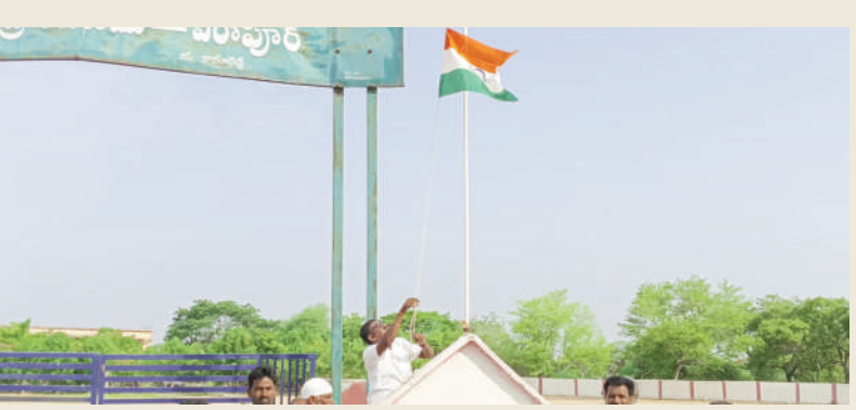
టైమ్స్ ఆఫ్ వార్త - బాన్సువాడ: