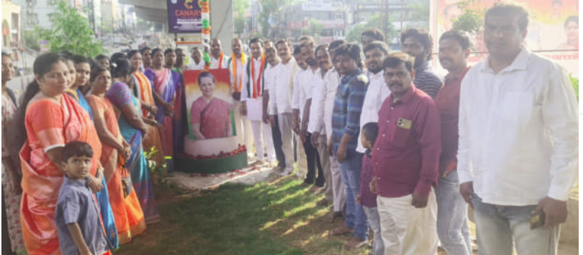
టైమ్స్ ఆఫ్ వార్త - కాకట్ల పల్లి