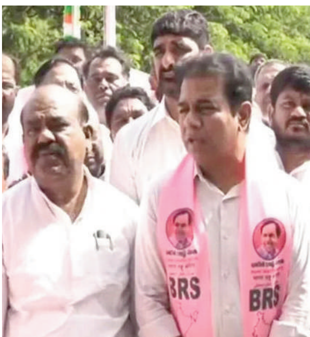
టైమ్స్ ఆఫ్ వార్త - హైదరాబాద్ :

'దశాబ్దాల స్వరాష్ట్ర కలను సాకారం చేసుకొని దశాబ్దం గడిచిన సందర్భం మిది. ఆధునిక భారతం కక్షరా చూసిన మరో స్వాతంత్ర్య పోరాటం మన తెలంగాణ ఉద్యమం. బక్కపలవని, ఉక్కు సంకల్పం కలిగిన కేసీఆర్ పోరాట ఫలితమిది. అమరవీరుల ప్రాణత్యాగాల పునాదులపై ఏర్పడిన కొత్త రాష్ట్రం మనది. సబ్బంద వర్గాలు కొట్లాడి, పొట్లాడి మా రాష్ట్రం మాకంటూ సాధించుకున్న ప్రత్యేక రాష్ట్రమిది. 60 ఏళ్ల విధ్వంస గాయాలను పడేస్తే వికాసంతో మాన్యమై పునర్నిర్మించిన తెలంగాణిది. పాలన చేతకాదంటూ నొసటితో వెక్కిరించిన వాళ్ల మనసు నిండా ప్రశంసించిన దశాబ్దమిది. తెలంగాణ ఆచరిస్తుంది.. దేశం అనుసరిస్తుండనలా అనితర సాధ్యంగా సాగింది ఈ దశాబ్ద ప్రయాణం. శతాబ్దం లో సాధ్యంకాని అద్భుతాలు దశాబ్దంలో చేసి చూపింది మన తెలంగాణ. నాడు కరవు, రాక్షసవర్షాలు, కల్లోలాల తెలంగాణ. నేడు పచ్చని, సుభిక్షమైన కోటి రతనాల వీణ నా తెలంగాణ. అదే సూర్యి, అదే సంకల్పం ఇకముందు ఉండాలని, తెలంగాణ దేశానికి దిక్సూచిగా కొనసాగాలని కాంక్షిస్తూ ఆకాంక్షిస్తూ.. ప్రతి ఒక్కరికీ తెలంగాణ దశాబ్ద ఉత్సావ శుభాకాంక్షలు.' అని కేటీఆర్ ట్వీట్ చేశారు.