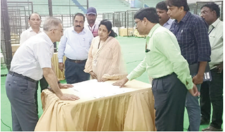
టైమ్స్ ఆఫ్ వార్డు - ఎట్టిసగర్ ప్రతినధి:

కౌంటింగ్ ఏర్పాటును వివరించిన ఏ.ఆర్.ఓ ఎన్.పంకజ