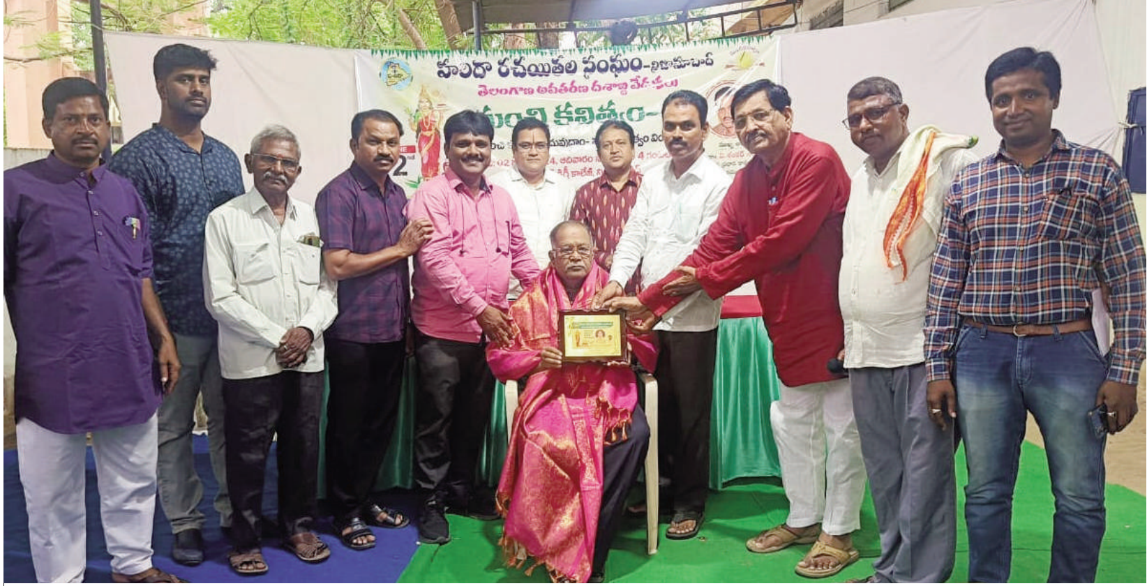
ప్రజల పక్షంగా పోరాడడం వారి లక్షణం

తెలంగాణ పునర్నిర్మాణంలో, అభివృద్ధిలో కవులు, రచయితల పాత్ర కీలకం