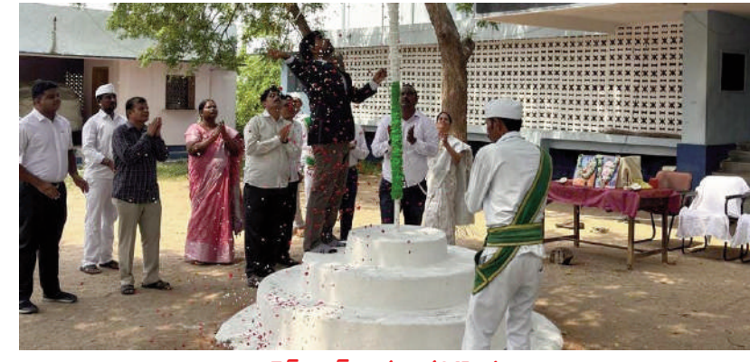
టైమ్స్ ఆఫ్ వార్డు - చలిగండ