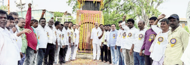
టైమ్స్ ఆఫ్ వార్త - బాన్సువాడ