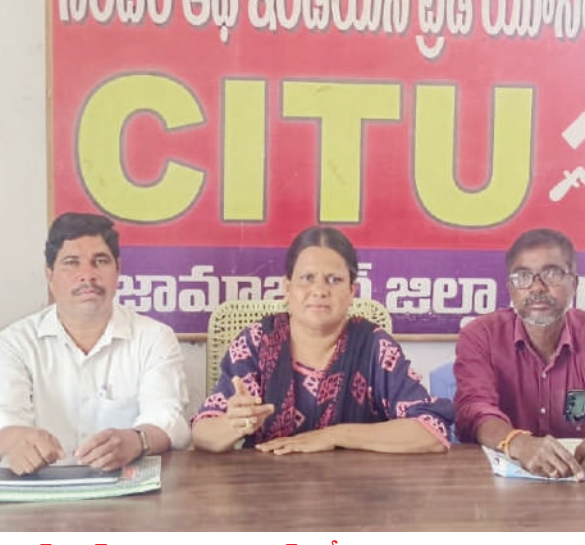
టైమ్స్ ఆఫ్ వార్త - నిజామాబాద్ సీటీ