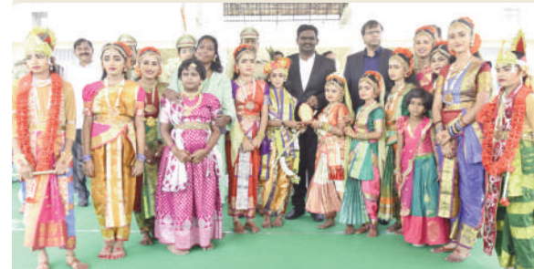
టైమ్స్ ఆఫ్ వార్త - నిజామాబాద్ సీటీ

తెలంగాణ రాష్ట్ర అవతరణ దినోత్సవ వేడుకలను పురస్కరించు కుని సమీకృత జిల్లా కార్యాలయాల సమదాయంలో చిన్నారలు ప్రదర్శించిన సాంస్కృతిక కార్యక్రమాలు ఆహుతులను అలరింప జేశాయి. తెలంగాణ సంస్కృతి సంప్రదాయాలను తమ కట్టు, బొట్టు, ప్రత్యేక వేష ధారణలతో ఆవిష్కరించజేశారు. చూడ చక్కని నృత్య ప్రదర్శనలతో జానపద కళ జెన్నత్యాన్ని చాచారు. ఎవరికి వారు చిన్నారలు పోటాపోటీగా చేసిన సాంస్కృతిక ప్రదర్శనలు ఉత్సాహాలకు ప్రత్యేక ఆకర్షణగా నిలిచాయి. కలెక్టర్ తో పాటు ప్రజా ప్రతినిధులు, అధికారులు ప్రదర్శనలు ముగిసిన అనంతరం చిన్నారలను వేదికపైకి ఆహ్వానించి అభినందిస్తూ ప్రోత్సహించారు.