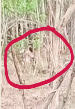
టైమ్స్ ఆఫ్ వార్త, మంచిర్యాల జిల్లా ప్రతినిధి:-

మండలంలోని గాంధారి వనం సమీపంలో వాగు ప్రాంతంలో బండ్ల వాగు ప్రాంతంలో సందర్శకులను, ప్రయాణికులు దృశ్య తీర్చుకోవడానికి వాగు ఒడ్డుకు వచ్చిన జింకల గుంపు కనువిందు చేసింది. సుమారు 30 పైగా జింకలు తమ దృశ్య తీర్చుకోవడానికి వాగు సమీపానికి రావడంతో, వాటిని చూసిన వీక్షకులు సంభ్ర మ పడ్డారు.