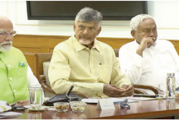
పీటన్నిటికి నిధులు కావాలంటే కేంద్రం ఆంధ్రప్రదేశ్ కు సత్కరం ప్రత్యేక హోదా ప్రకటించాల్సింది.

అంశంపై మమ్మరంగా చర్చ జరుగుతుంది. అంతేగాక దేశ రక్షణ పరిధిలోని రక్షణ శాఖతో పాటు ఇదే సంఘ శాఖలను బిజెపి ఇతర పార్టీలకు కేటాయిస్తారా అన్న అంశంపై కూడా మమ్మరంగా రాజకీయ విశ్లేషకులు చర్చించుకుంటున్నారు. భవిష్యత్తులో పార్టీలు మారిన పార్లమెంట్ సభ్యులను పార్టీ ఫిరాయింపుల చట్టం కింద నియంత్రించాలన్న పార్టీలో కలుపుకోవాలని కీలకమైన పాత నిర్ణయించే స్పీకర్ పదవిని భారతీయ జనతా పార్టీ తన దగ్గర ఉంచుకుంటుందా, కూటమిలోని ఏదైనా రాజకీయ పార్టీ సీనియర్ పార్లమెంటేరియన్ ను నియమిస్తూనే వేచి చూడాలిందేనని రాజకీయ విశ్లేషకులు అభిప్రాయపడుతున్నారు. అంతేగాక ప్రస్తుత పరిస్థితులలో ఆంధ్రప్రదేశ్ రాష్ట్రం అభివృద్ధిలో తిరులోగమనం వైపు వయస్సుంది. చంద్రబాబు భావిస్తున్న అభివృద్ధి విజన్ ను అమర్ పర్చాలంటే నెలకొని ఉన్న ఆర్థిక పరిస్థితులను అధిగమించేందుకు రాష్ట్రానికి ప్రత్యేక హోదా అనివార్యమైంది. మాజీ ముఖ్యమంత్రి జగన్ ఆటకెక్కించిన అమరావతి రాష్ట్ర రాజధానిగా తీర్చిదిద్దాల్సిన బాధ్యత చంద్రబాబు నాయుడు పై ఉంది. పోలవరానికి జాతీయ హోదా, విశాఖ ఉక్కు పరిశ్రమ పునరుద్ధరణ, అమరావతి రాజధాని లో మున్సిల్ కోసం హోస్ నిర్మాణం, 50 సంవత్సరాల దాటిన మున్సిల్ కు పెన్షన్లు, మజిలీలో ప్రార్థనలు జరిపే ఇమామలకు పదివేల జీతం మున్సిల్ అభివృద్ధి ఎన్నికల అభివృద్ధి వంటి వాటికి కావాల్సిన లక్షలాది కోట్ల నిధులను కేంద్రం నుంచి తీసుకోవాల్సి ఉంటుంది.