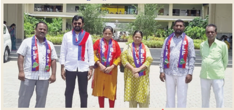
టైమ్స్ ఆఫ్ వార్త - నిజామాబాద్ సీట్