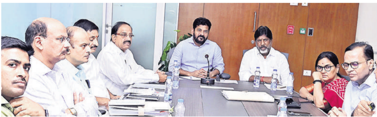
రుణమాఫీకి విధివిధానాలు రూపొందించండి పూర్తి చేయాలి. ప్రణాళిక సిద్ధం చేయండి : అధికారులతో సమీక్షలో ముఖ్యమంత్రి రేవంత్ రెడ్డి