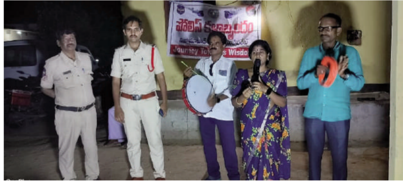
టైమ్స్ ఆఫ్ వార్త - ఎడపల్లి