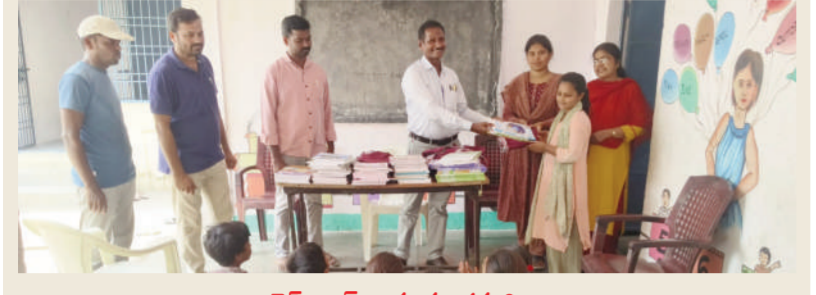
టైమ్స్ ఆఫ్ వార్త, మండలమర్రి:-

మండలంలో నిర్వహిస్తున్న తాగునీటి సౌకర్యం సర్వేను పకడ్బందీగా నిర్వహించాలని మండల ఎంపీడి.ఎన్ రాజేశ్వర్ సూచించారు. బుధవారం ఆయన మండలంలోని బొక్కలగుట్ట, పులి మడుగు, అందుగులపేట, గ్రామపంచాయతీ లను సందర్శించి, సర్వేను తనిఖీ చేశారు. అనంతరం బొక్కల గుట్ట గ్రామంలో ప్రభుత్వ పాఠశాలను సందర్శించి పాఠశాలలో అమ్మ ఆదర్శ పాఠశాల కమిటీ ఆధ్వర్యంలో నిర్వహిస్తున్న పనులను పరిశీలించి, పనులు త్వరగా పూర్తి చేయాలి ఆదేశించారు. ఆదేశించిన పాఠశాలలో నిర్వహిస్తున్న మధ్యాహ్న భోజన పథకం గురించి విద్యార్థులు అడిగి తెలుసుకున్నారు. అనంతరం గ్రామంలోని సర్కిల్ ని సందర్శించి, మొక్కల పెంపకం పై సర్కిల్ సిబ్బందికి సలహాలు, సూచనలు అందజేశారు. అనంతరం అందుగులపేట గ్రామంలో నిర్వహిస్తున్న పైవ్ లైన్ లీకేజీ మరమ్మత్తు పనులను తనిఖీ చేశారు. అనంతరం పులిమడుగు గ్రామంలోని ప్రభుత్వ పాఠశాలలో విద్యార్థులకు ఏక రూప దుస్తులు పంపిణీ చేశారు. ఈ కార్యక్రమంలో ఆయా గ్రామాల పంచాయతీ కార్యదర్శులు, పాఠశాల ఉపాధ్యాయులు, సిబ్బంది తదితరులు పాల్గొన్నారు.