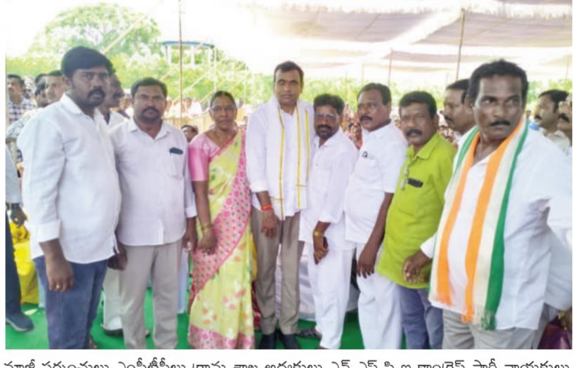
మాజీ సర్పంచులు ఎంపీటీసీలు గ్రామ శాఖ అధ్యక్షులు ఎన్ ఎన్ సి ఐ కాంగ్రెస్ పార్టీ నాయకులు కార్యకర్తలు పాల్గొన్నారు.