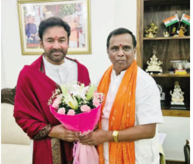
తైమ్స్ ఆఫ్ వార్త - నిజామాబాద్ సిటీ