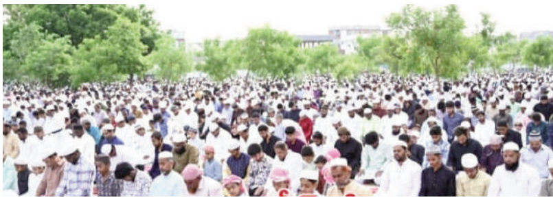
టైమ్స్ ఆఫ్ వార్త - బాన్సువాడ:

బాన్సువాడ పట్టణంలోని ఈడ్డా మైదానంలో సోమవారం బిక్రీడ్ పండుగ సందర్భంగా ముస్లిం సోదరులు ప్రత్యేక ప్రార్థనలు నిర్వహించారు. అనంతరం ఒకరినొకరు కలుసుకొని ఆలింగనం చేసుకొని బిక్రీడ్ పండుగ శుభాకాంక్షలు తెలుపుకున్నారు. ఈడ్డా వద్ద ముస్లిం సోదరులకు ఎలాంటి ఇబ్బందులు కలగకుండా ముస్లింల ఆధికారులు, సిబ్బంది, సౌకర్యాల కల్పించడంతోపాటు పోలీసు బందోబస్తు నిర్వహించారు. ఈ కార్యక్రమంలో బాన్సువాడ పట్టణంలోని ముస్లిం సోదరులు, తదితరులు, పాల్గొన్నారు.