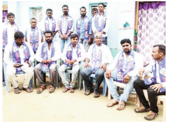
రాష్ట్రవ్యాప్తంగా గత ప్రభుత్వం 12000 పాఠశాలను మూసివేసింది. ప్రస్తుత ప్రభుత్వం విద్యాహక్కు చట్టాన్ని అమలు చేయాలని కోరుతున్నారు.

మాదిగ రిజర్వేషన్ పోరాట సమితి తెలంగాణ కామారెడ్డి జిల్లా అధ్యక్షులు రూ సీ గాం భూమయ్య