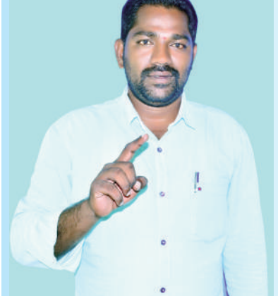
తైమ్స్ ఆఫ్ వార్త - బాన్సువాడ: