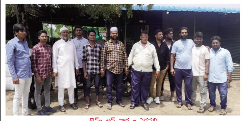
టైమ్స్ ఆఫ్ వార్త - ఎడపల్లి

ఎడపల్లి మండల కేంద్రంలో పాటు ఆయా గ్రామాలలో ముస్లిం సోదరులు సోమవారం బిక్రీడ్ పండుగను ఘనంగా నిర్వహించారు. ఈమేరకు బిక్రీడ్ పండుగను పురస్కరించుకొని ఎడపల్లి మండల కేంద్రంలోపాటు జాన్సంపేట్, నెహ్రూనగర్, కుర్నాపల్లి, ఏల్యూ క్యాంప్, గ్రామాలలో ముస్లిం సోదరులు ఈడగలకు వెళ్లి ప్రత్యేక ప్రార్థనలు చేశారు. దీంతో మండలంలోని మసీదుల వద్ద ముస్లిం సోదరులు సూతన వస్త్రాలను ధరించి ప్రత్యేక ప్రార్థనలో పాల్గొని సమాజ నిర్వహించారు. అనంతరం ఒకరినొకరు ఆలింగనం చేసుకొని పండుగ శుభాకాంక్షలు తెలుపుకున్నారు. అలాగే పలువురు హిందు సోదరులు ముస్లింలకి పండుగ శుభాకాంక్షలు తెలిపారు. ఈసందర్భంగా పలువురు మత పెద్దలు ముస్లింలు మాట్లాడుతూ... తమ పవిత్ర