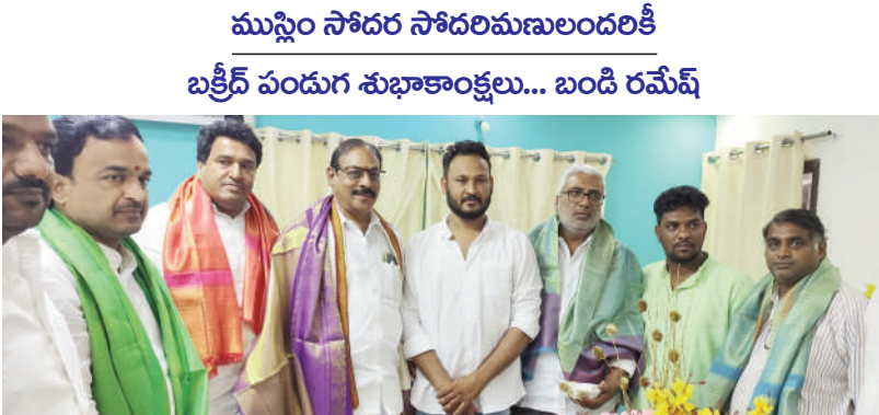
తైమ్స్ ఆఫ్ వార్త - కూకట్ పల్లి