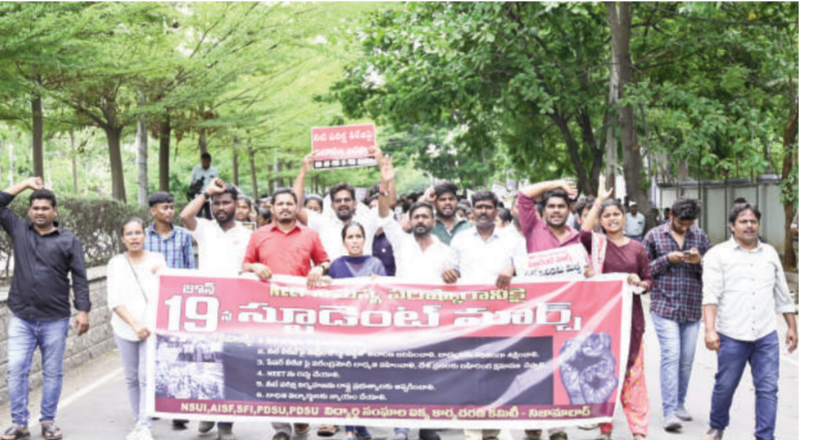
24 లక్షల నీటి విద్యార్థులకు న్యాయం చేయాలి

విద్యార్థులకు న్యాయం చేయని వెళ్లంలో ఎంపీ అరవింద్