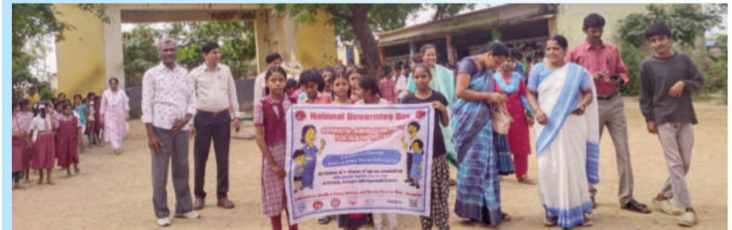
టైమ్స్ ఆఫ్ వార్త - మాక్లూర్.