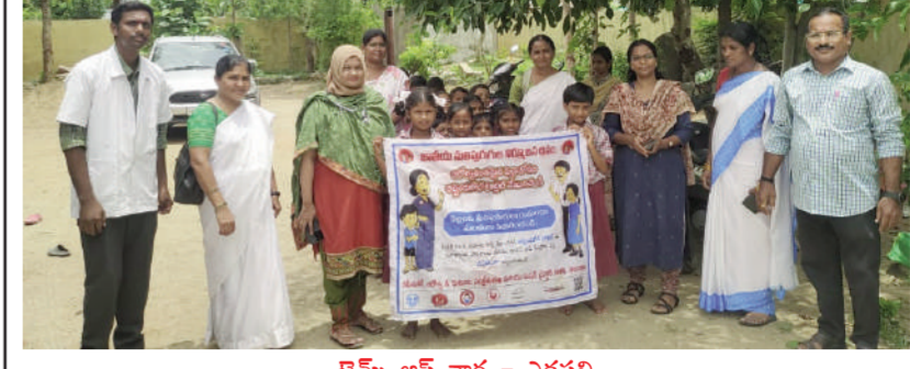
టైమ్స్ ఆఫ్ వార్త - ఎడపల్లి ఈ నెల 20 నిర్వహించే జాతీయ నులిపురుగుల నివారణ దినోత్సవం సందర్భంగా మండలంలోని ఆయా గ్రామాల్లోని గవర్నమెంట్ స్కూల్ స్టూడెంట్స్ తో అవగాహన ర్యాలీ నిర్వహించారు. ఈమేరకు గ్రామాల్లో వీధుల గుండా స్టూడెంట్స్ ర్యాలీ నిర్వహించారు. నులిపురుగుల వల్ల జరిగే అనారోగ్య సమస్యలు ప్రజలకు వివరించారు. 19 సంవత్సరాల లోపు వయసున్న ప్రతి ఒక్కరూ ఈనెల 20 డివార్సింగ్ డేట్ జులై 15 వేళుకోవాలని నిరూపించారు. నులిపురుగుల వలన కలిగే అనారోగ్య, వాటిని అరికట్టడం వంటి విషయాలను వివరిస్తూ గ్రామాల్లో ర్యాలీ నిర్వహించారు. ఈ కార్యక్రమంలో ఆయా స్కూల్ టీచర్లు, అశాలు, వైద్య సిబ్బంది, అశాలు, సెక్రటరీలు తదితరులు పాల్గొన్నారు.