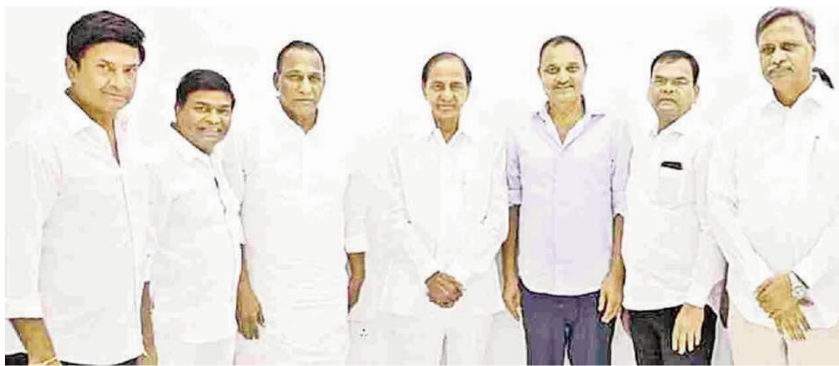
టైమ్స్ ఆఫ్ వార్త - హైదరాబాద్ :

ఆరు నెలల్లో అన్నీ తారుమారవుతాయి.. పార్టీ నాయకులతో కేసీఆర్