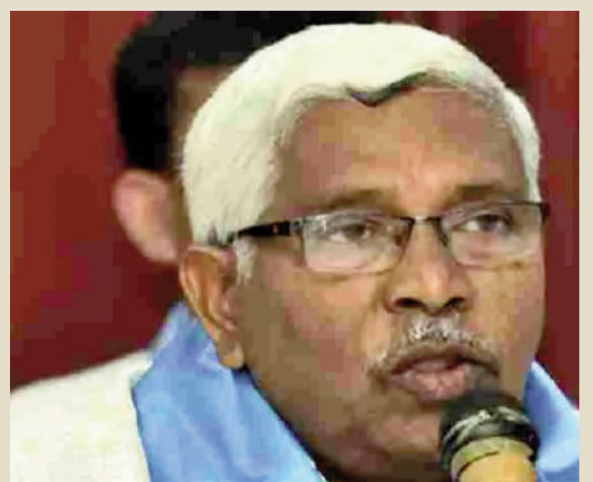
తుమ్మిడి హెడ్డిని పునఃపరిశీలించాలి: కోదండరాం