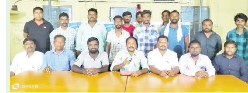
తైమ్స్ ఆఫ్ వార్త, మండపంట్రి:-