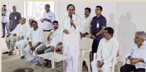
సీఎం పదవి అనేది పెద్ద విషయం కాదు : కేసీఆర్