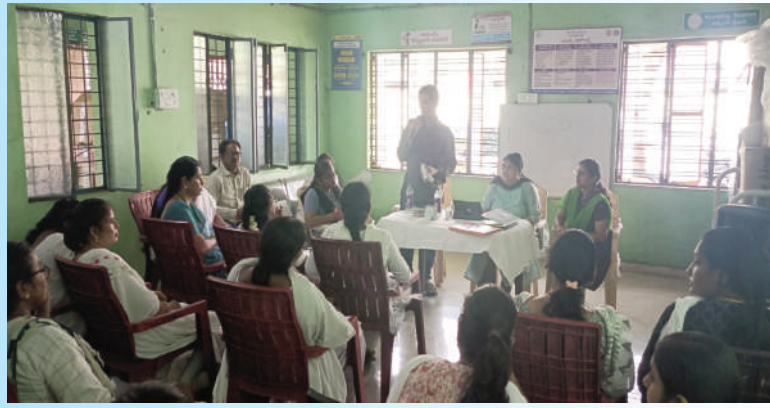
తైమ్స్ ఆఫ్ వార్త, మండపంట్రి:-