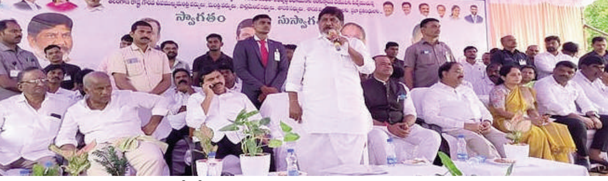
ఆగస్టు కాదు అంతకన్నా ముందే చేసి చూపిస్తాం..