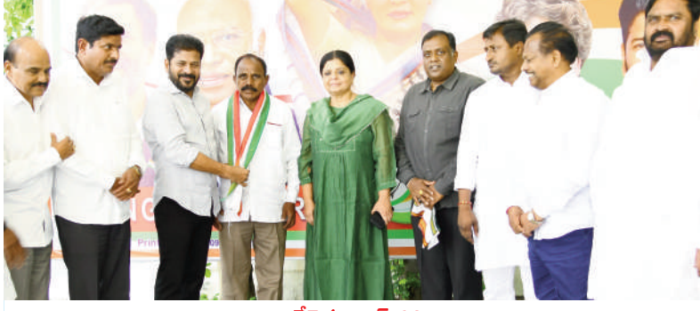
చేవెళ్ల: జూన్ 28