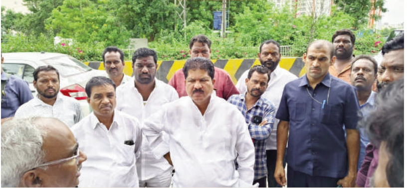
తైమ్స్ ఆఫ్ వార్త - కూకట్ పల్లి