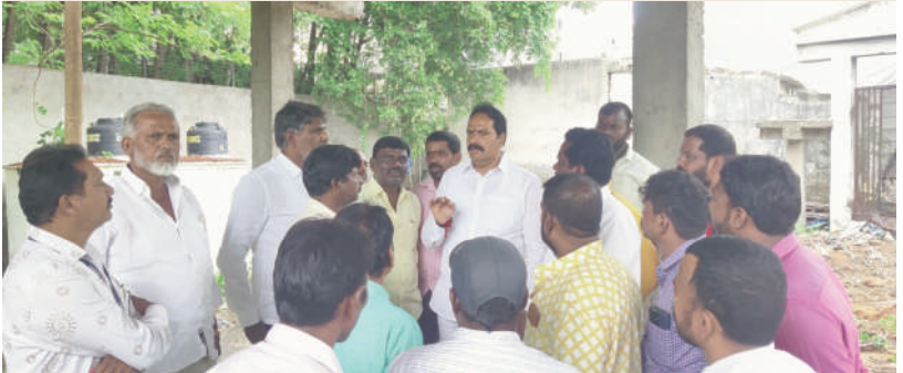
తైమ్స్ ఆఫ్ వార్త - కూకట్ పల్లి