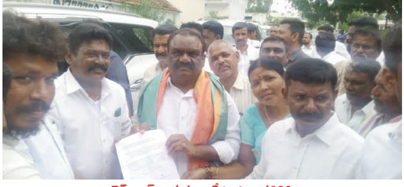
తైమ్స్ ఆఫ్ వార్త సూర్యాపేట జిల్లా ప్రతినిధి