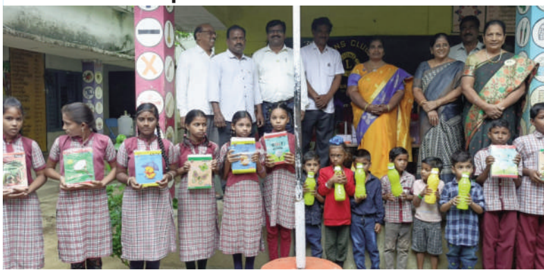
టైమ్స్ ఆఫ్ వార్త-బోధన్