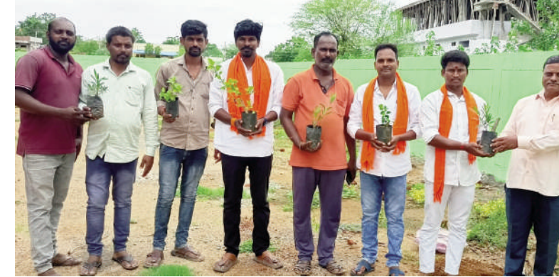
టైమ్స్ ఆఫ్ వార్త - బాన్సువాడ