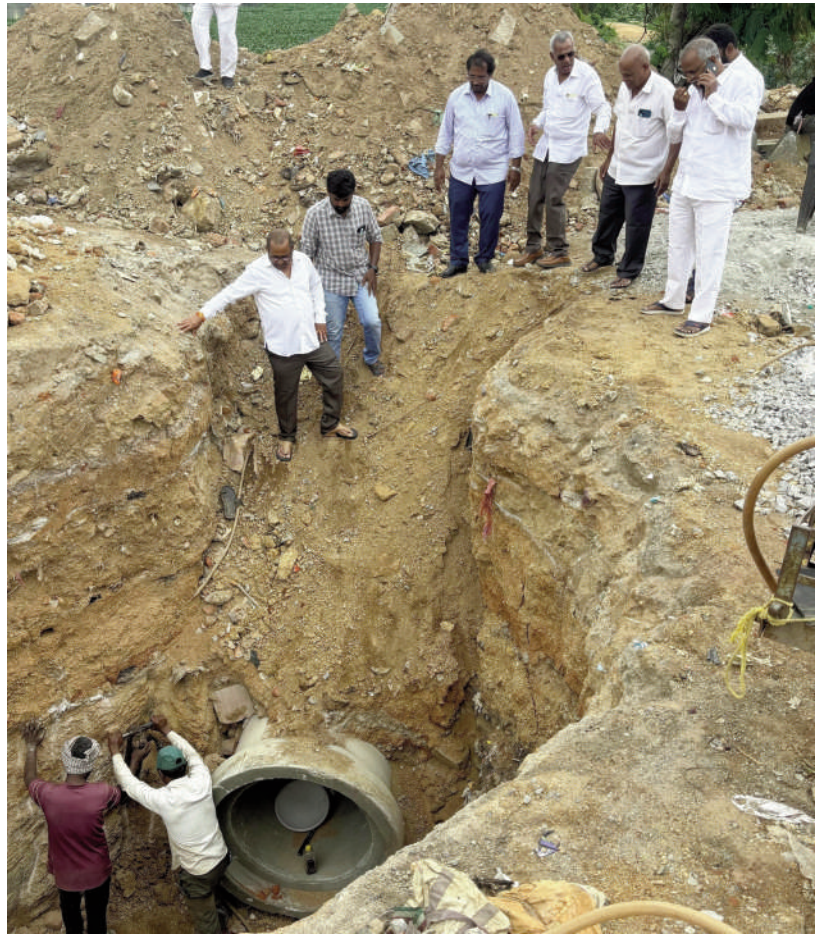
తైమ్స్ ఆఫ్ వార్త - కూకట్ పల్లి