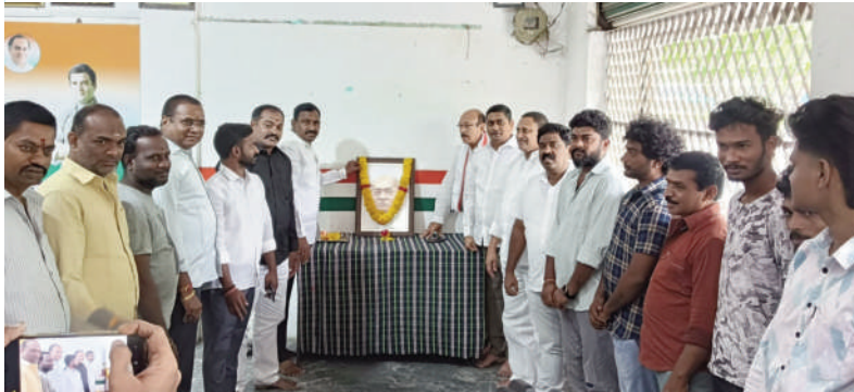
టైమ్స్ ఆఫ్ వార్త - నిజామాబాద్ సీట్