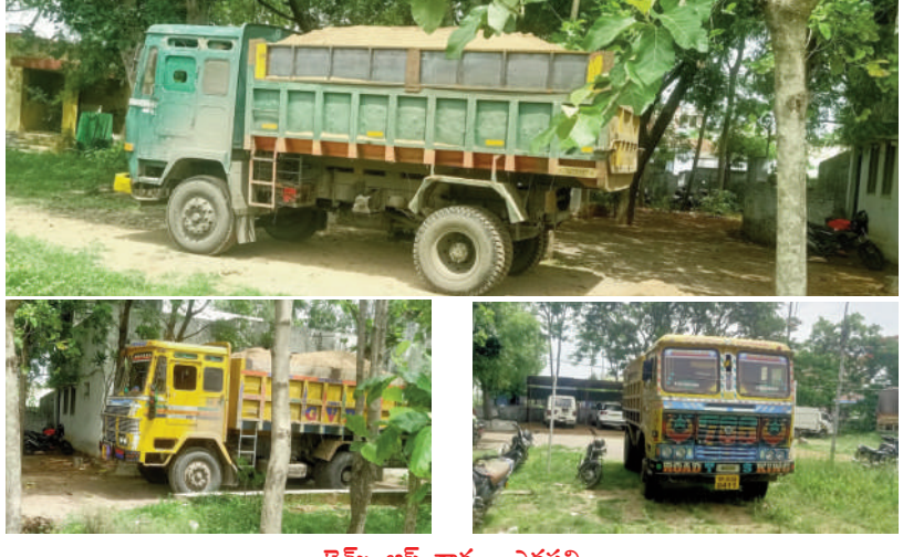
తైమ్స్ ఆఫ్ వార్త - ఎడపల్లి