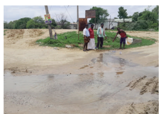
సంపులో నుండి నీరు మొత్తం లీకేజై గ్రామంలో మిషన్

టైమ్స్ ఆఫ్ వార్త - ఎడపల్లి రాష్ట్రంలో ప్రతి ఇంటికి మంచినీటిని అందించాలనే ఉద్దేశంతో గత ప్రభుత్వం మిషన్ భగీరథ పథకాన్ని ప్రారంభించింది. దీనికోసం వేల కోట్లు రూపాయలను వెచ్చించింది. ప్రజల కోసం ఇంత ఖర్చు చేసిన సిబ్బంది నిర్లక్ష్యం కారణంగా ప్రజాధనం వృధాగా మారుతుంది.నీటి కోసం ప్రజలు ఇబ్బందులు పడకుండా ప్రభుత్వాలు పథకాలకు శ్రీకారం చుడుతుంటే క్షేత్ర స్థాయిలో మాత్రం వీటి ఫలితాలు ఆశాజనకంగా లేకుండా పోతున్నాయి.రెండురోజులుగా మిషన్ భగీరథ వాల్స్ దగ్గర పైవే పగిలి నీరు వృధాగా పోతూ డ్రైనేజీలో కలుస్తున్నా పట్టించుకునే వారు లేకుండా పోయారని ఎడపల్లి మండలంలోని అంబం (పై) గ్రామ వాసులు ఆగ్రహం వ్యక్తంచేశారు.రెండు రోజుల క్రితం మిషన్ భగీరథ వాల్స్