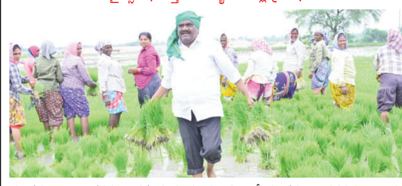
టైమ్స్ ఆఫ్ వార్త - సూర్యాపేట జిల్లా ప్రతినిధి