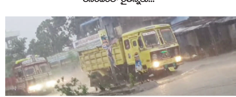
టైమ్స్ ఆఫ్ వార్త - ఎడపల్లి

నిజామాబాద్ జిల్లాలో ఏకదాటి వర్షం కురవడంతో పలు ప్రాంతాలు జలమయమయ్యాయి. రోడ్లపై వెళ్ళే లోతు నీరు నిలిచింది. వాహనదారులు, పాదచారులు భారీ వర్షం కారణంగా తీవ్ర ఇబ్బందులు ఎదుర్కొన్నారు. నగరంతో పాటు జిల్లాలోని పలు ప్రాంతాల్లో, శివారు ప్రాంతాల్లోనూ వర్షం దంచికొట్టింది. సుమారు రెండు గంటల పాటు వర్షం కురవడంతో రోడ్లన్నీ జలమయమై చెరువులను తలపించాయి. వర్షాకాండ ప్రారంభమై నెలరోజులు గడిచినా వర్షాలు కూరవకపోవడంతో రైతున్నలు ఆందోళనకు గురయ్యారు. కొన్ని ప్రాంతాల్లో పరిస్థితులు సైతం వేరులేదు. పరిస్థితులు వేసిన రైతులు ఆందోళనకు లోనయ్యారు. సాగునీరు లేక ఎండిపోయే పరిస్థితి ఏర్పడింది. ఈ క్రమంలో సోమవారం కులిసిన భారీ వర్షంతో రైతున్నలు భార్య వ్యక్తం చేస్తున్నారు. ఇక తమ పంటలకు దోకా లేదని ఆనందం వ్యక్తం చేస్తున్నారు. రెండు గంటల పాటు కురిసిన భారీ వర్షాలకు చెరువులు, కుంటలోకి భారీగా వరదనీరు చేరుకొంటుందని, బోరు బావుల్లో సైతం నీటిమట్టం పెరుగుతుందని రైతులు పేర్కొంటున్నారు.