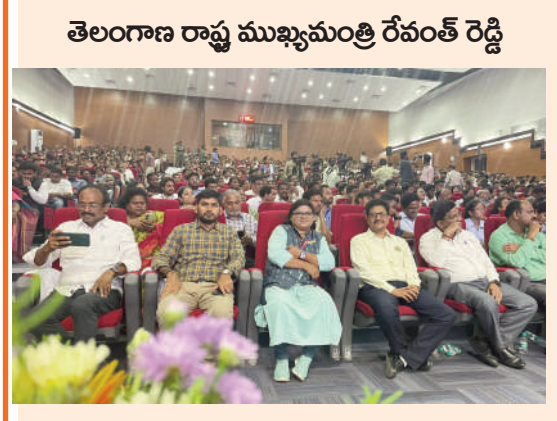
తెలంగాణ రాష్ట్ర ముఖ్యమంత్రి రేవంత్ రెడ్డి

జై.ఎన్.టి.యూ హైదరాబాద్ లో ఈనెల 13న ఆడపిల్లల రక్షణ, పుష్కరికా మొదలైనవిని యోగం, డ్రగ్స్ వాడకం, రహదారి భద్రతల వంటి నాలుగు అంశాలపై అవగాహన కార్యక్రమాన్ని నిర్వహించడం జరిగింది. భారతదేశంలో ప్రప్రథమంగా ఈ నాలుగు అంశాల సమస్యల పరిష్కారానికి కమ్యూనిటీ పోలీసింగ్ ఎన్ఎస్ఎస్ఎస్ భాగస్వామ్యం ఆవశ్యకత ప్రణాళిక సిద్ధం చేసి ముఖ్యమంత్రి రేవంత్ రెడ్డి చేతులమీదుగా ప్రారంభించడం జరిగింది. ఈ కార్యక్రమానికి ముఖ్య అతిథిగా విచ్చేసిన సీఎం రేవంత్ రెడ్డి మాట్లాడుతూ తాను మారుమూల గ్రామంలో పుట్టి ప్రభుత్వ బడుల్లో కళాశాలలో విద్యను అభ్యసించానన, నగర కాన్వెంట్ లలో విదేశీ విశ్వ విద్యాలయాల్లో తాను చదువుకోలేదని, విద్యపై దృష్టి సారినే విజయం తద్దమన్నారు. బిల్ గేట్స్, నరేంద్ర మోడీ ఎంఐఐ పై వారి కైనా కాలం రోజుకు 24 గంటలు మాత్రమే అని, ఇందులో ధనికులకు పేదలకు ఎవరికి మినహాయింపు లేదన్నారు. ప్రతి మనిషికి ఎనిమిది గంటలు నిద్ర అవసరమని, మిగతా 16 గంటల కాలాన్ని పుణ్య చేయకుండా వారికి సచ్చిన వాటిపై దృష్టి సారించి, సమాజంలోని స్థితిగతులపై అవగాహన పెంచుకొని మంచి మార్పుకు పరిష్కార దిన ప్రణాళిక రూపొందించుకొని నాయకుడిగా ఎదగాలన్నారు. తన ముందు కూర్చున్న విద్యార్థిలే తేవీటి