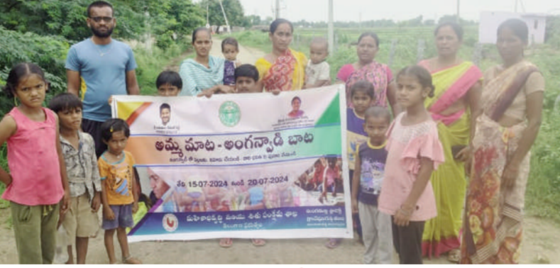
టైమ్స్ ఆఫ్ వార్త - సూర్యాపేట జిల్లా ప్రతినిధి

తుంగతుర్తి మండల పరిధిలోని దేవుని గుట్ట తండా గ్రామంలోని గ్రామస్థులు పెద్దలు తల్లిదండ్రులు గ్రామంలోని అంగన్వాడీ పాఠశాలకు ప్రతి ఒక్కరూ పంపివ్వాలని వారికి పౌష్టిక ఆహారంతో సహా పాఠశాలలో డ్రస్సు వారికి ఆటపాటలతో విద్యా బోధన కొన్ని ఆటల పరికరాలతో ఆటలు ఆడిపియడం వారికి ప్రతిరోజు ఒక గుడ్డును ఇస్తూ మధ్యాహ్నం వేళలో పండ్లు బిస్కెట్లు ఇచ్చి పాఠశాలలో ఆహారాభ్యాసాన్ని తల్లిదండ్రుల కన్నా అంగన్వాడీ పంతులమ్మలే ఆ పిల్లలకు సేవలు అందిస్తూ ఆటపాటలతో విద్యను బోధిస్తూ ఐదు సంవత్సరాల లోపు ఉన్న పిల్లలందరికీ అంగన్వాడీ కేంద్రానికి తీసుకువెళ్లి వారికి ఆటపాటలతో విద్యను బోధిస్తూ పై చదువుల కోసం వారిని తయారు చేస్తూ ఆయతో వారికి సఫల్యాలు చేస్తూ సేవలు అందిస్తున్నామని అంగన్వాడీ కేంద్రంలోని ఉపాధ్యాయులు ఆయలు పిల్లలతో గ్రామంలో ఉర్రేగింపుగా ఈరోజు బడి బాటకు రావాలని పిలుపునిచ్చారు. గ్రామంలో పిల్లల తల్లిదండ్రులను ఉద్దేశించి మాట్లాడుతూ ప్రతిరోజు పిల్లలను అంగన్వాడీ కేంద్రంలో తోలి పోవాలని అన్ని సౌకర్యాలు కల్పిస్తామని భరోసా ఇచ్చారు. ఈ కార్యక్రమంలో పిల్లల తల్లిదండ్రులు అంగన్వాడీ డీపర్సు పాల్గొన్నారు.