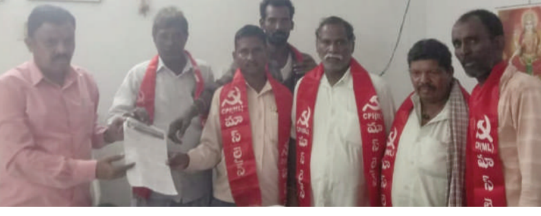
టైమ్స్ ఆఫ్ వార్త - ఎడపల్లి