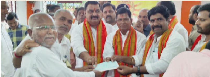
టైమ్స్ ఆఫ్ వార్త - ఏలూరలో ప్రతినిధి: