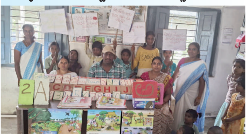
టైమ్స్ ఆఫ్ వార్త - బాన్సువాడ: