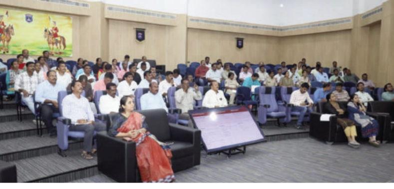
టైమ్స్ ఆఫ్ వార్త - కాకట్ పల్లి