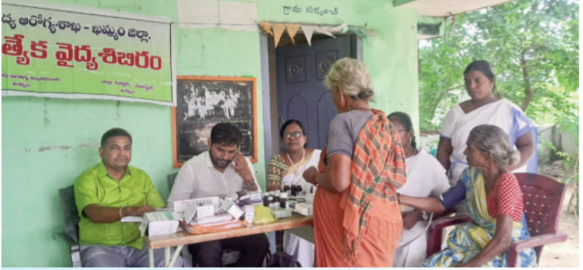
టైమ్స్ ఆఫ్ వార్త చింతకాని