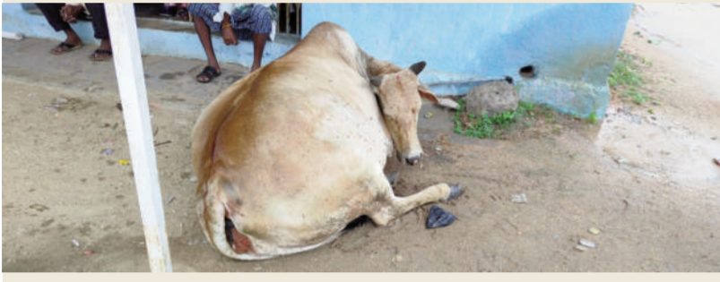
టైమ్స్ ఆఫ్ వార్త - ఎడపల్లి

దేవుని మాన్యానికి చెందిన ఆవుకు మత్తుమందు ఇచ్చి ఎత్తుకెళ్లెందుకు చేసిన ప్రయత్నం విఫలం కావడంతో చోరీకి పాల్పడిన వ్యక్తులు వాహనంలో వరాలైన ఘటన ఎడపల్లి మండల కేంద్రంలో సోమవారం అర్రుతాల్ చోటుచేసుకుంది. వివరాలిలా ఉన్నాయి. రాత్రి సమయంలో గుర్తు తెలియని నలుగురు వ్యక్తులు ఎడపల్లి గ్రామంలోని ఎంపీడీఓ కార్యాలయం సమీపంలో పడుకొని ఉన్న దేవుని మాన్యానికి చెందిన ఆవుకు మత్తు ఇంజక్షన్ ఇచ్చి ఇన్సైవా టాపీ లేని వెహికల్ లో ఎత్తుకుపోవడానికి ప్రయత్నం చేయగా గ్రామస్థులు చూసి పట్టుకునే ప్రయత్నం చేశారు. ఈ క్రమంలో నలుగురు వ్యక్తులు ఇన్సైవా వెహికల్ తో పాటు పారిపోయారు. మత్తుమందు ఇంజక్షన్ తో ఆవు అపస్వారక స్థితిలో ఉన్నా ఆవు పరిస్థితి బాగానే ఉందని పోలీసులు తెలిపారు.