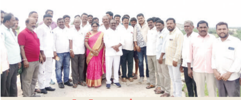
టైమ్స్ ఆఫ్ వార్త - సూర్యాపేట జిల్లా ప్రతినిధి