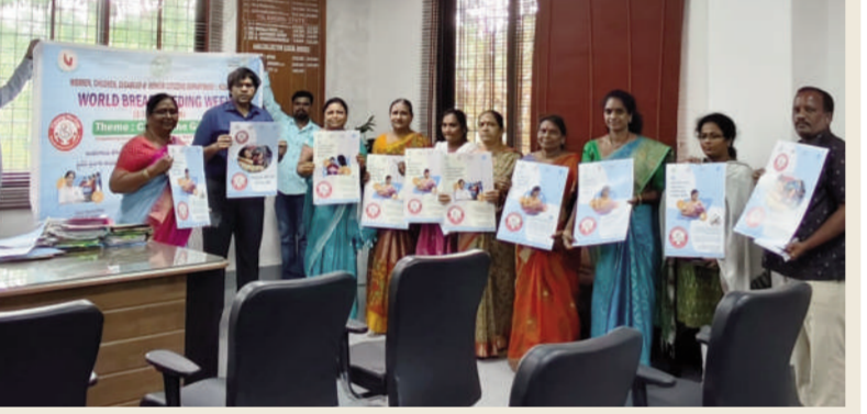
టైమ్స్ ఆఫ్ వార్త - నిజామాబాద్ సీట్