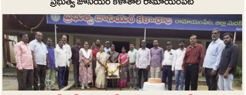
ప్రభుత్వ జూనియర్ కళాశాల రామాయంపేట