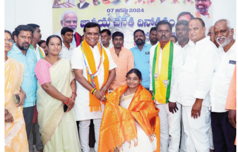
టైమ్స్ ఆఫ్ వార్త - నిజామాబాద్ సీట్