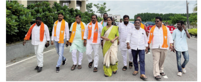
టైమ్స్ ఆఫ్ వార్త - నిజామాబాద్ సీట్