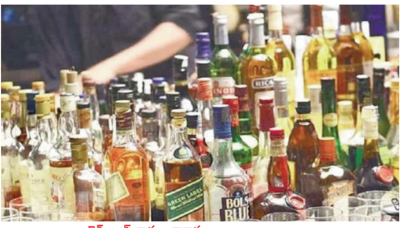
బ్రెమ్స్ ఆఫ్ వార్త - నాగారం

నాగారం మండలంలో బెల్ట్ షాపులు జోరుగా సాగుతున్నాయి. పల్లెల్లో ఎక్కడ చూసినా బెల్ట్ షాపులు కిక్కు పుట్టాకా కనిపిస్తోంది. ఏ గ్రామంలో చూసినా బెల్ట్ షాపులు పుట్టగొడుగులా వెలుస్తున్నాయి. అనుమతులు లేకుండా విచ్చలవిడిగా వ్యవహరిస్తున్నారు. దీంతో పరమస్పృతో సంబంధం లేకుండా యువత మద్యానికి బానిస అవుతూ జీవితాలను నాశనం చేసుకుంటున్నారు. యువత మద్యానికి బానిసై మరణాలకు దిగుతూ నేరస్తులుగా మారి పలు కేసుల్లో చిక్కుకుంటున్నారు. అనుమతులు లేకుండా ఇష్టానుసారంగా బెల్ట్ షాప్ లో నిర్వహిస్తున్న ఎక్సైజ్ శాఖ అధికారులు కన్నెత్తి చూడకపోవడంతో అంతర్వేమేటని పలు పురు ప్రశ్నిస్తున్నారు. బెల్ట్ షాపుల్లో అబార్బి శాఖ అధికారులకు భారీ గా ముడుపులు మూడుతున్నట్లు ప్రజలు అనుకుంటున్నారు. గ్రామంలో బెల్ట్ షాప్ నిర్వహిస్తున్నారని సమాచారం తెలివిన తూతూ మంత్రంగా తనిఖీలు చేపడుతూ అధికారులు చేతులు దులుపుకుంటున్నారనే ఆరోపణలు వస్తున్నాయి. పల్లె ప్రాంతాల్లో తండాల్లో గూడెంలలో ఎక్కడ చూసినా బెల్ట్ షాపుల నిర్వహణ చేపడుతూ ధనాన్నే ధ్యేయంగా నిర్వాహకులు నిర్వహిస్తున్నట్లు ఆరోపణలున్నాయి. ఇదిలా ఉంటే మరోవైపు బెల్ట్ షాపుల నిర్వాహకులు క్వార్టర్లపై రూ.40 నుంచి