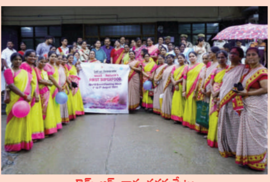
టైమ్స్ ఆఫ్ వార్త-చర్యపేట: