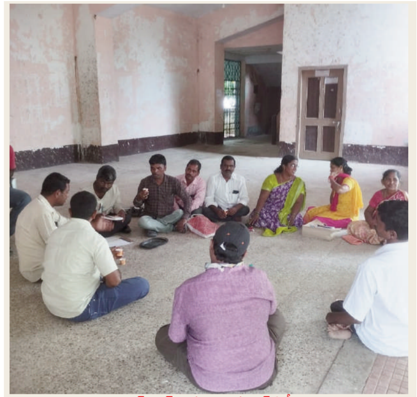
టైమ్స్ ఆఫ్ వార్త - నిజామాబాద్ సీట్