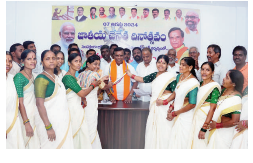
టైమ్స్ ఆఫ్ వార్త - నిజామాబాద్ సీట్