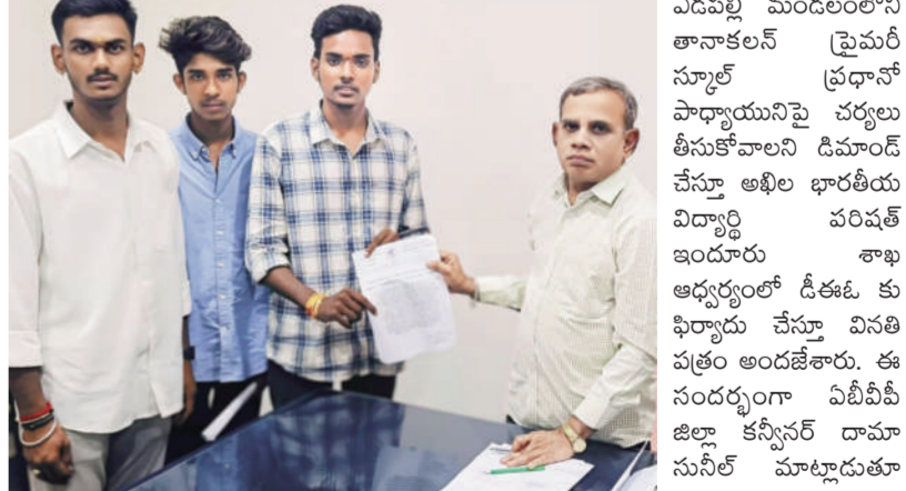
టైమ్స్ ఆఫ్ వార్త - నిజామాబాద్ సీట్