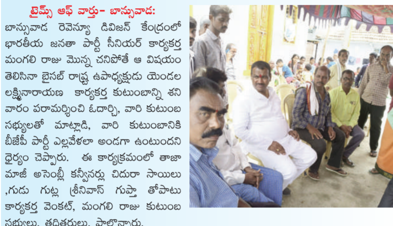
మాజీ ఎమ్మెల్యే ఎండాల లక్ష్మీనారాయణ