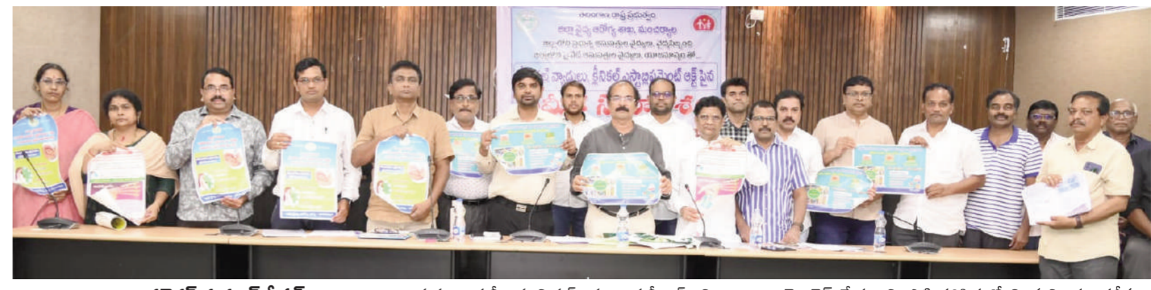
జిల్లా కలెక్టర్ కుమార్ దీపక్