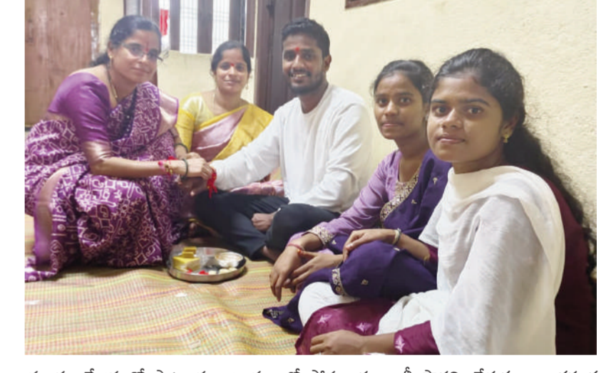
టైమ్స్ ఆఫ్ వార్త-బిక్కూర్

మండల కేంద్రంలో పాటు పలు గ్రామాలలో సోమవారం రాఖీ ప్రార్థన వేడుకలు అంగరంగ వైభవంగా నిర్వహించారు. సోదరీ సోదరుల ఆప్యాయత అనుబంధానికి రక్షాబంధన్ అర్పణ లాగా నిలుస్తుంది. ఇట్టి బంధాన్ని పురస్కరించుకొని అన్న తమ్ముళ్లకు అక్క చెల్లెళ్లకు రాఖీలు కట్టి రక్షాబంధన్ శుభాకాంక్షలు తెలియజేశారు. ఆనంతరం అన్నదమ్ములూ ఆశీస్సులు తీసుకున్నారు. ఈ సందర్భంగా వారికి మిత్రులు తినిపించారు. ఆనందోత్సవాల మధ్య వేడుకలు జరుపుకున్నారు.