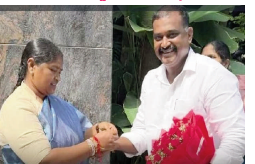
టైమ్స్ ఆఫ్ వార్త - భిక్షువార్