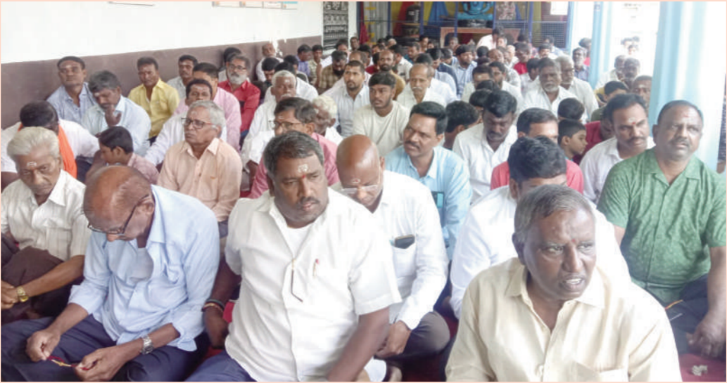
టైమ్స్ ఆఫ్ వార్త-బాన్సువాడ