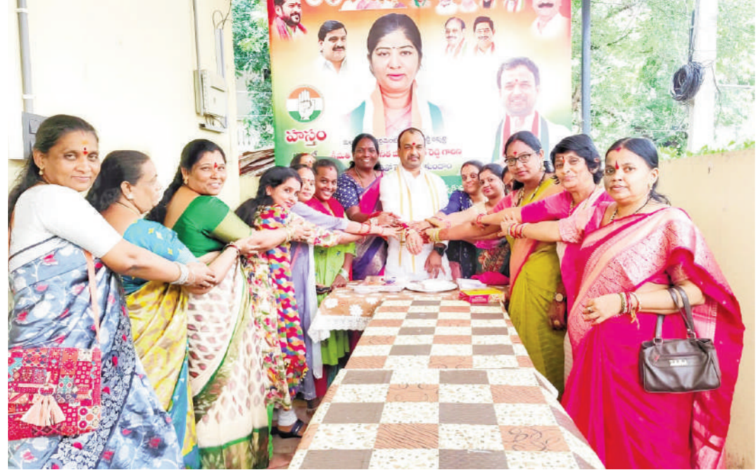
ప్రభుత్వం తగిన చర్యలు చేపడుతుందని అన్నారు. సభ్యుల మధ్య ఆనందంగా సంతోషకరంగా జరుపుకోవాలని ఆదేశించి పండుగను చక్కటి వాతావరణంలో కుటుంబ అన్నారు.