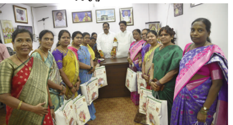
టైమ్స్ ఆఫ్ వార్త - కూకట్ పల్లి