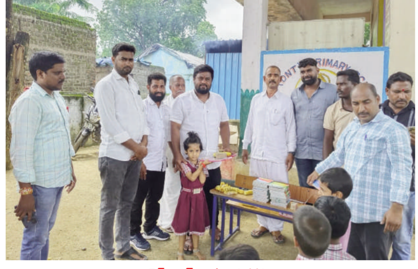
బ్రెమ్మి ఆఫ్ వార్త - ఎడపల్లి