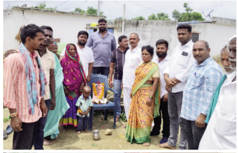
బ్రెమ్మి ఆఫ్ వార్త - ఎడపల్లి