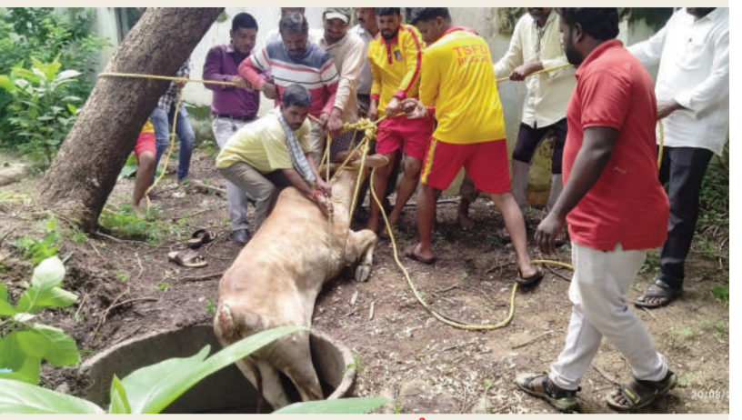
బ్రెమ్మి ఆఫ్ వార్త - బోధన్